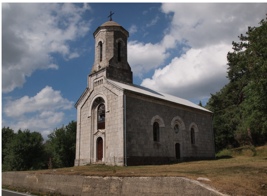
4. Parohijska crkva svetog Save u Jošanima, završena 1881