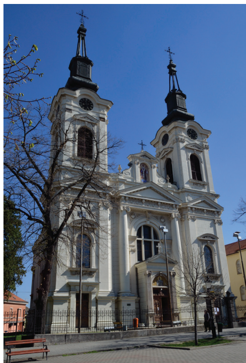
10. Glavno pročelje Saborne crkve u Sremskim Karlovcima nakon restauracije izvede- ne prema projektu Vladimira Nikolića, 1907–1909; fotografija autora članka