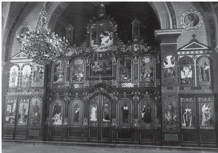
9. Ikonostas Saborne crkve Vavedenja Presvete Bogorodice u Plaškom, djelo Vinka Ra- uschera (arhitektonski okvir) i Ivana Tišova (ikone), 1906–1907; Ministarstvo kulture, Uprava za zaštitu kulturne baštine, fototeka