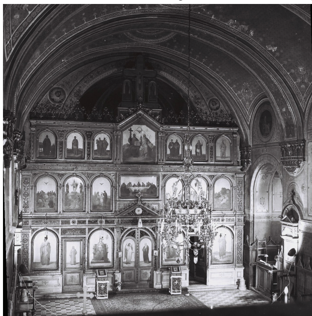
6. Saborna crkva u Pakracu nakon restauracije izvedene prema projektu Hermana Bolléa, 1893–1896; Uprava za zaštitu kulturne baštine, Osijek