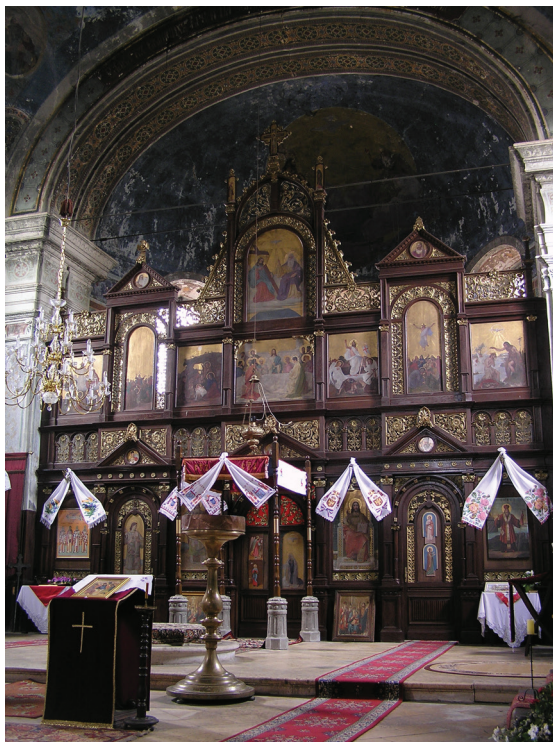
7. Unutrašnjost parohijske crkve u Bjelovaru, restaurirane 1901–1902