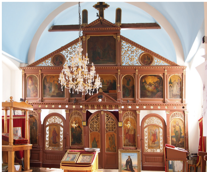
16. Marko Peroš, Ikonostas parohijske crkve u Bršadinu, 1903; fotografija autora članka