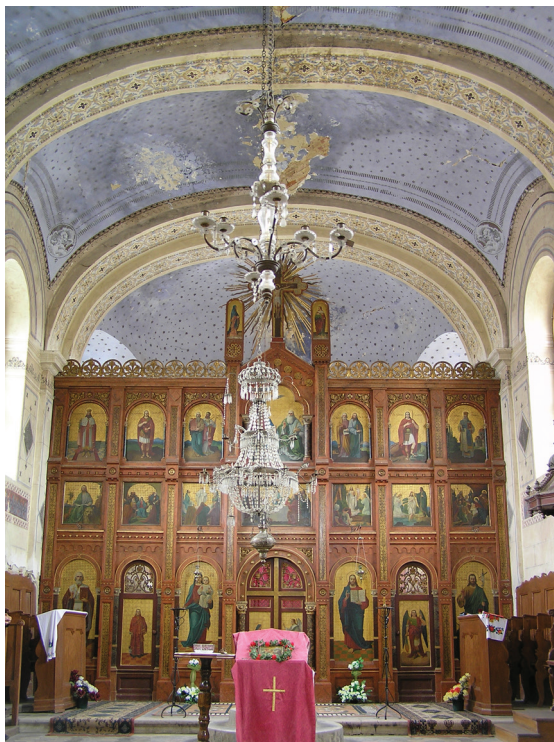
15. Marko Peroš, Ikonostas parohijske crkve u Velikoj Barni (1889?)