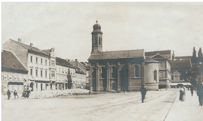
11. Preobraženjska crkva u Zagrebu 1899, prije promjene kupole i pročelja; Muzej grada Zagreba (MGZ 5578)