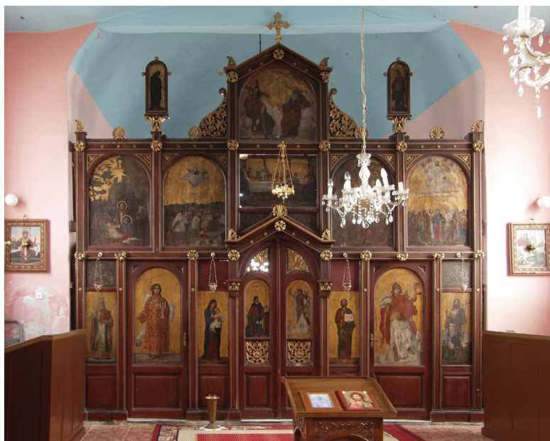
17. Ivan Tišov, Ikonoostas parohijske crkve u Pačetinu, 1909–1910