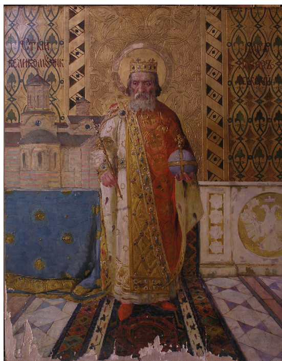
14. Celestin Medović, Sveti knez Lazar, ikona s ikonostasa parohijske crkve u Bjelovaru, 1901–1902