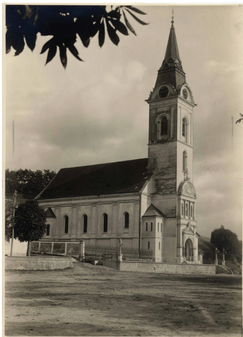
5. Saborna crkva u Pakracu nakon restauracije izvedene prema projektu Hermana Bolléa, 1893–1896; Ministarstvo kulture Republike Hrvatske, zbirka fotografija