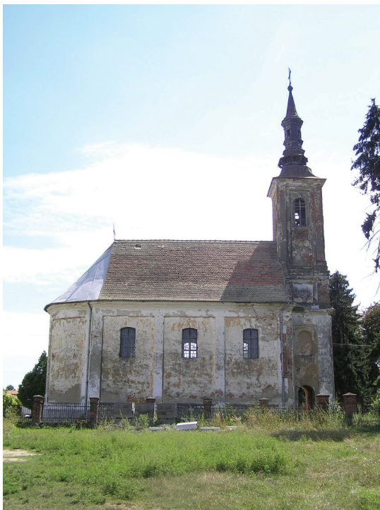
3. Parohijska crkva u Bračevcima, kraj 18. stoljeća