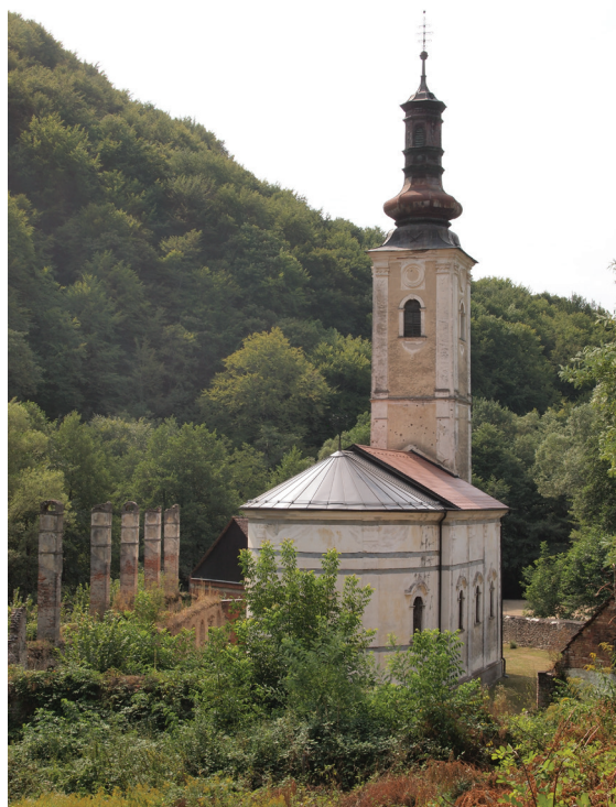
2. Manastir Pakra