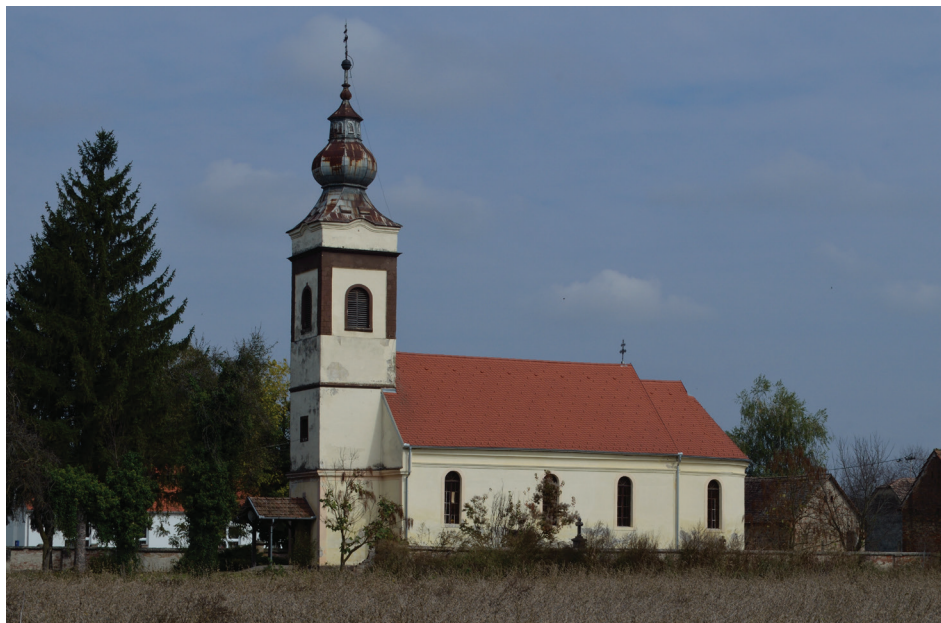
1. Parohijska crkva u Kapelni, 1833