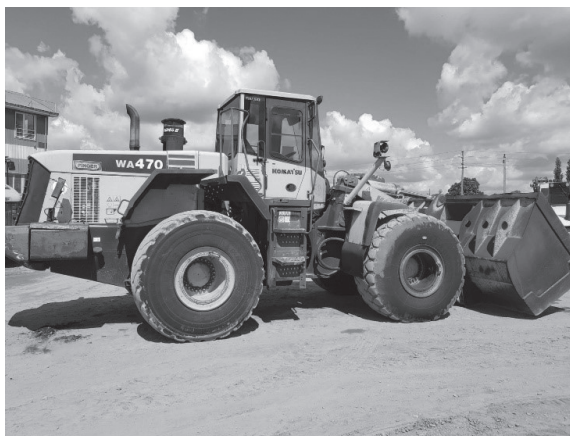
Slika 1. Utovarivač

Očividom je utvrđeno da na poklopcima motora utovarivača nije bilo plinskih opruga, koje su sastavni dio opreme utovarivača, u skladu s uputama proizvođača, i služe za lakše otvaranje i zatvaranje poklopca motora te sprečavaju nekontrolirani pad poklopca.