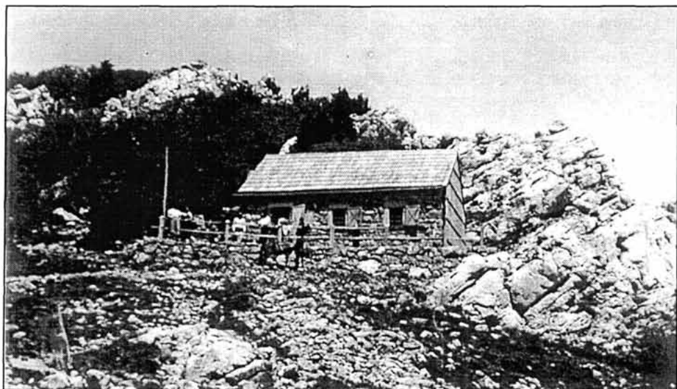
Sl. 6. Zapadna strana Vučjaka na sj. Velebitu s Krajačevom kućom (1654 m). Danas planinarski dom "Zavižan".