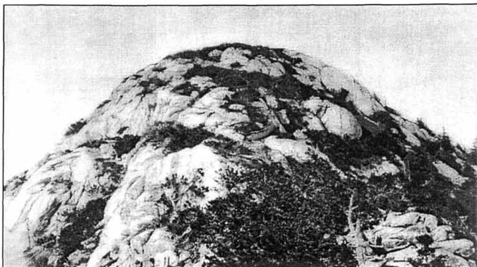
Sl. 5. Rožanski kukovi na sjevernom Velebitu: Glavica Krajačeva Kuka (1690 m).