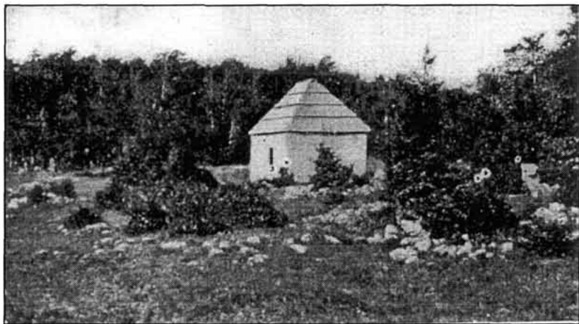
Sl. 3. Krajačeva kuća na Senjskom bilu