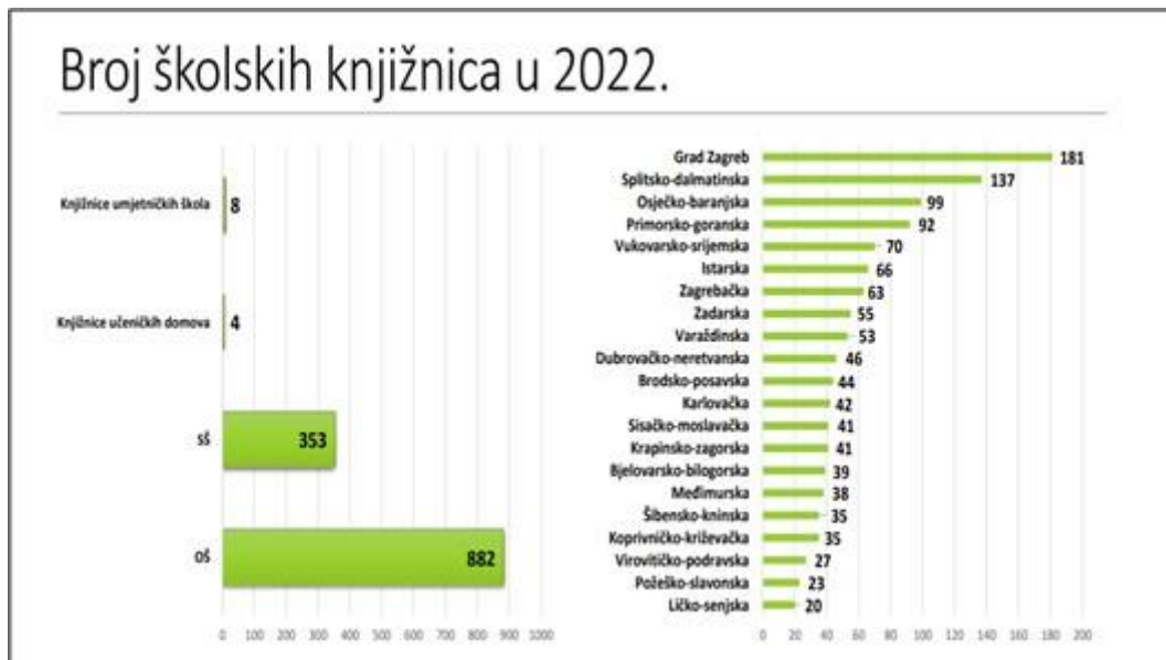
Slika 2. Slajd prezentacije Analiza stanja školskih knjižnica na županijskoj i nacionalnoj razini

a koliko Ministarstvo znanosti i obrazovanja u 2022. godini. Izlaganje je potaknulo raspravu o važnosti kvalitetnog vođenja evidencije za poboljšanje statusa školskih knjižnica.