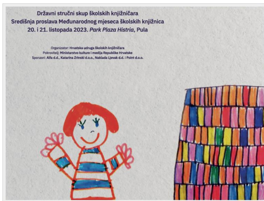
Slika 1. Plakat državnog stručnog skupa Školska knjižnica – moje sretno mjesto

Tema Međunarodnog mjeseca školskih knjižnica 2023. (International School Library Month) bila je Školska knjižnica: moje sretno mjesto . Pod istim nazivom, Hrvatska udruga školskih knjižničara održala je 13. samostalni stručni skup 20. i 21. listopada 2023. u Puli, okupivši školske knjižničare Republike Hrvatske i stručnjake koji se bave školskim knjižničarstvom (HUŠK n.d). Stručni skup održava se svake godine u drugom gradu/županiji s ciljem osnaživanja školskoga knjižničarstva i podružnica Udruge u svim dijelovima Republike Hrvatske.