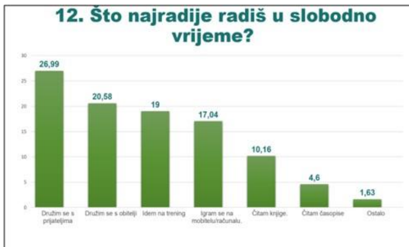
Slika 6. Slajd prezentacije Čitateljske navike učenika osnovnih i srednjih škola Istarske županije

I autorice ovog rada osmislile su zajedničku aktivnost inspirirane ovogodišnjom temom Međunarodnog mjeseca školskih knjižnica te snimile video Sretan učenik u školskoj knjižnici: prikazi i priče u kojima učenici iz dvije osječke osnovne škole govore o tome zašto vole čitati i boraviti u knjižnici te zašto je knjižnica mjesto gdje osjećaju mir, slobodu i sreću.