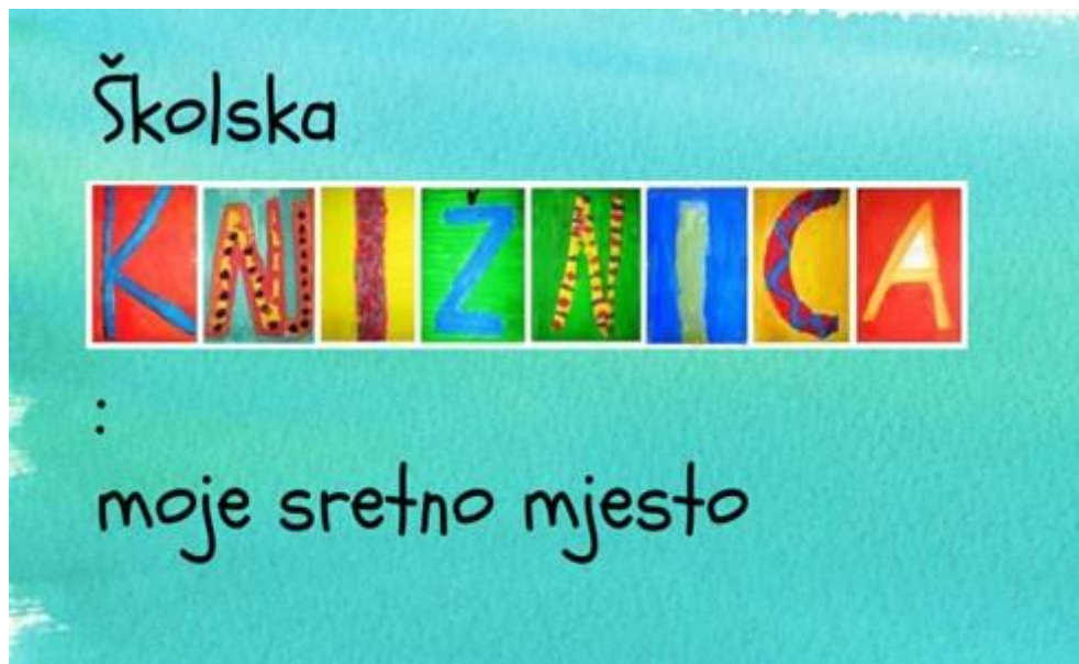
Slika 4. Naslovnica prezentacije Školska knjižnica – moje sretno mjesto

i jesu li upravo knjižnice unutar škola, škole u određenim mjestima, gradovima, županijama, državama ta središnja duhovna mjesta koja imaju potencijal postati "genius loci" kroz svoju ulogu u oblikovanju duhovnog i intelektualnog okruženja.