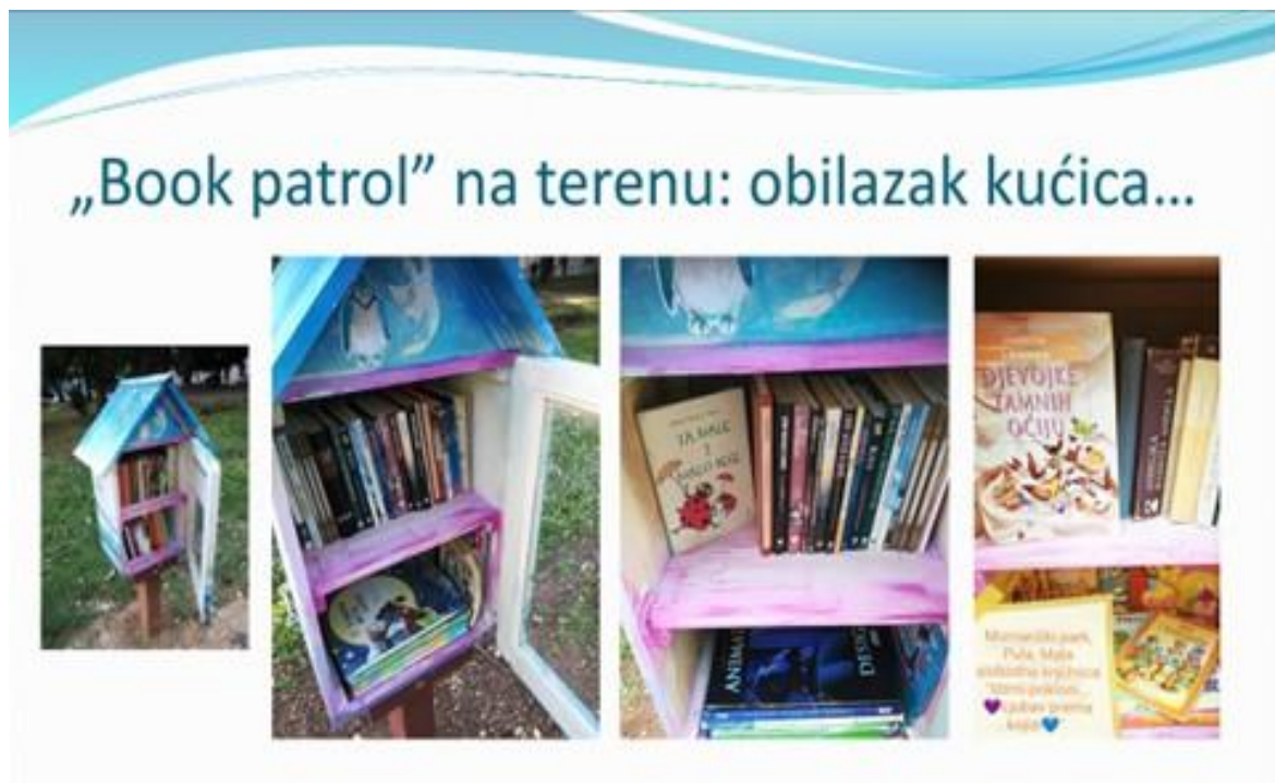
Slika 5. Naslovnica prezentacije Projekt Book patrol

Članice projektnog tima, Amadea Draguzet i Dragica Pršo, predstavile su rezultate istraživanja čitalačkih navika učenika osnovnih i srednjih škola Istarske županije provedenog u školskoj godini 2022./2023. Cilj istraživanja bio je identificirati čimbenike motivacije i demotivacije učenika u vezi s čitanjem, temama, grafičkim oblikovanjem knjige, stilom pisanja, okolinskim uvjetima, roditeljskim stavovima i poteškoćama s čitanjem, kao interesom za lekturu, druge knjige i dječje časopise.