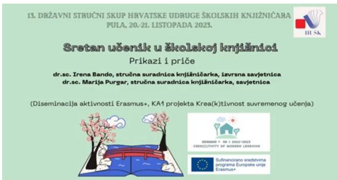
Slika 7. Naslovnica prezentacije Sretan učenik u školskoj knjižnici: prikazi i priče

I autorice ovog rada osmislile su zajedničku aktivnost inspirirane ovogodišnjom temom Međunarodnog mjeseca školskih knjižnica te snimile video Sretan učenik u školskoj knjižnici: prikazi i priče u kojima učenici iz dvije osječke osnovne škole govore o tome zašto vole čitati i boraviti u knjižnici te zašto je knjižnica mjesto gdje osjećaju mir, slobodu i sreću.