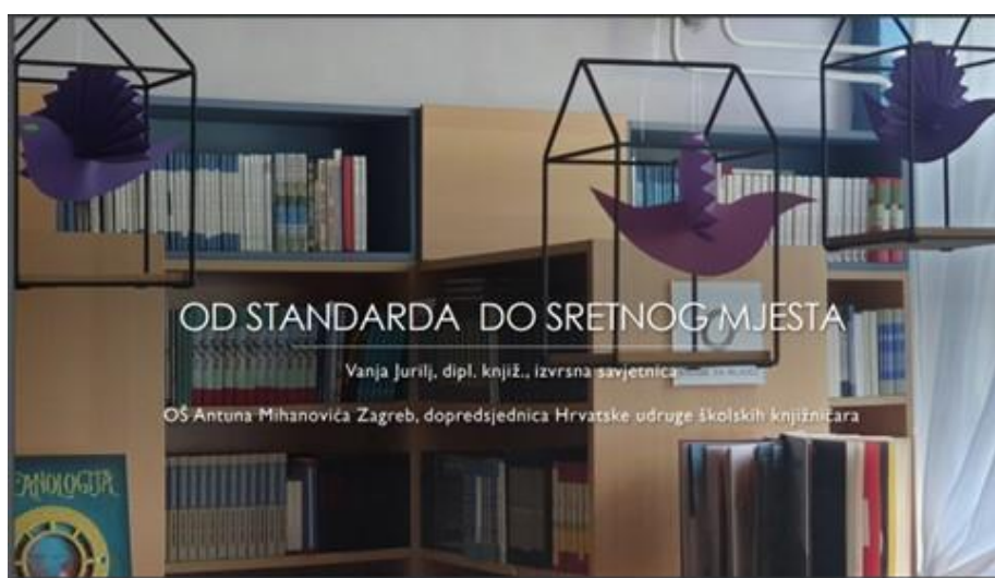
Slika 3. Naslovnica prezentacije Od standarda do sretnog mjesta

Vanja Jurilj, dugogodišnja školska knjižničarka u zvanju izvrsne savjetnice i potpredsjednica Hrvatske udruge školskih knjižničara, predstavila je promjene u novom Standardu za školske knjižnice (NN 61/2023). Fokusirajući se na odredbe poput proračuna za nabavu knjižnične građe, izazvala je duboku raspravu o implementaciji i izazovima s kojima se knjižničari suočavaju. Od 2019. do 2023. godine, Jurilj kao članica Hrvatskog knjižničkog vijeća, sudjelovala u izradi najnovijeg Standarda za školske knjižnice koji je stupio na snagu 14. lipnja 2023.