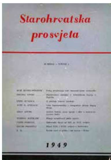
Sl. 1. Starohrvatska prosvjeta, s. III, sv. 1, 1949.

Fig. 1 / Abb. 1 Starohrvatska prosvjeta, s. III, vol./Band 1, 1949.