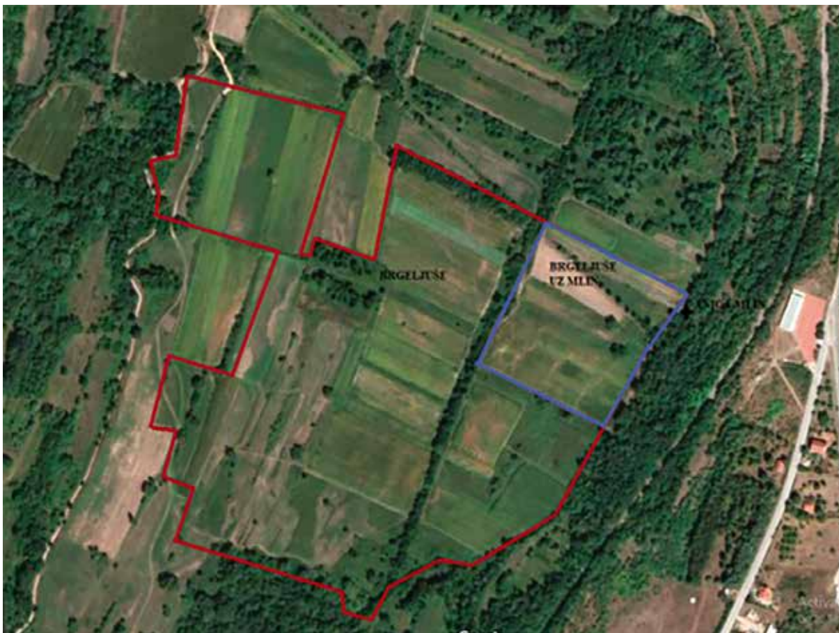
Sl. 2. Brgeljuše u Lugu. Plavom bojom obilježene su parcele u blizini Anića mlina