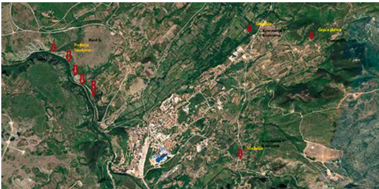
Sl. 6. Lokacije pronalaska bizantskih zlatnika u Kninskom polju i Smokovcu