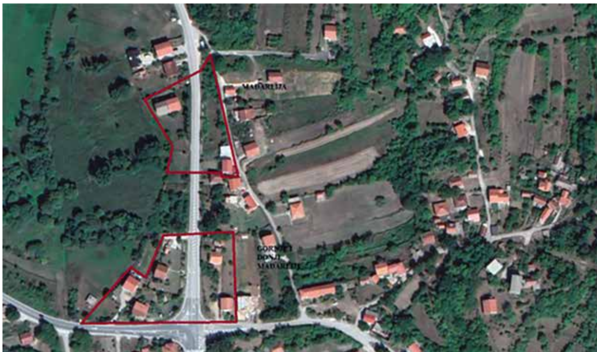
Sl. 1. Parcele Mađarlije Fig. 1 Mađarlija land plots

staviti je da su početkom 20. st. činile jedinstvenu cjelinu. Mađarlije su dodatno obilježene oznakama Gornje i Donje , a okvirno ih dijeli današnja moderna cesta. Gornje Mađarlije smještene su više na padini 19 i pretežito su u vlasništvu obitelji Jejina i Simić – Zukva dok su Donje Mađarlije smještene u podnožju te su u vlasništvu obitelji Ćuruvija i Republike Hrvatske. Kako je vidljivo iz teksta, parcele se javljaju u obliku jednine i množine, a sve zajedno obuhvaćaju katastarske čestice br. 3173, 3174, 3175, 3177, 3179/2, 3180/1, 3179/1, 3177, 3155, 3156/1, 3156/2, 3156/3, 3147/2, 3148/2, 3147/1, 3148/1, 3149 i 3150 k. o. Knin (sl. 1). Na fotografiji br. 1 označena su područja koja se u Starinarskim dnevnicima odnose na zemlju Mađarliju.