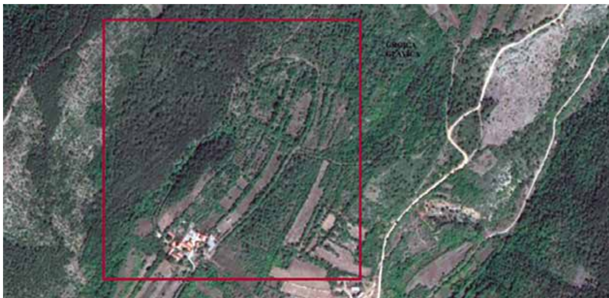
Sl. 5. Grgića glavica u Vrpolju Fig. 5 Grgića glavica in Vrpolje

Iako arheološki izuzetno zanimljivo, područje Vrpolja nije nikada arheološki istraživano, no brojni nalazi poznati su iz literarnih izvora, ponajprije Starinarskih dnevnika . 53 Opisivanje vlastitih spoznaja o posebnostima Vrpolja u arheološkom kontekstu, preraslo bi okvire ovog rada, pa ovdje namjeravam dati samo kraći komentar o nekim posebnostima Grgića glavice koji ukazuju na potencijalno zanimljiv arheološki lokalitet. Smještaj glavice na sjevernom rubu polja, padine koje se pomalo terasasto spuštaju s južne strane prema polju i klancu na istoku kojim je trasirana stara cesta prema Grahovu polju, 54 upućuju na vrijedan strateški značaj. Osim toga, blizina izvora Milakovca ukazuje na važan preduvjet funkcioniranju manjeg antičkog ili srednjovjekovnog ruralnog naselja. Podnožje glavice također sadrži bogatu toponimiju, jer čak 4 uzdužne parcele nose toponimsku oznaku Vratarice , što može biti faktor otkrića nekog sakralnog objekta u blizini ili groblja uz crkvu. 55 Smatram da