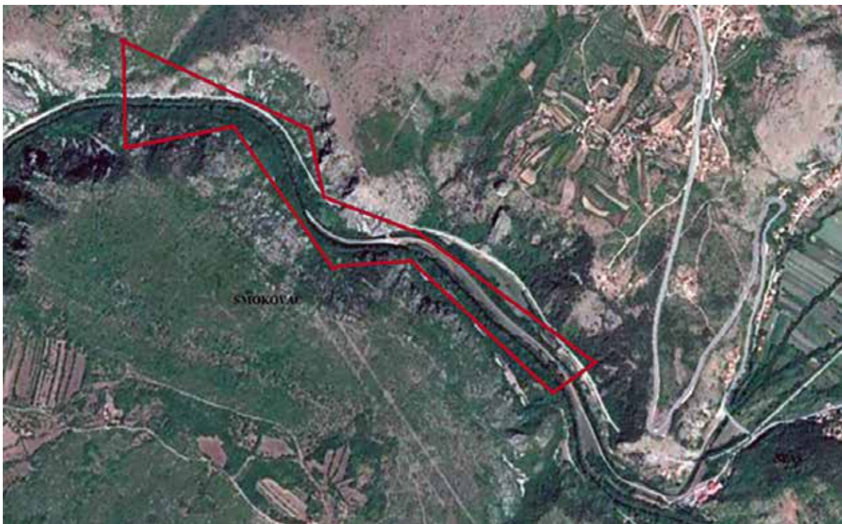
Sl. 4. Šire područje Smokovca označeno crvenom bojom Fig. 4 The wider area of Smokovac marked in red

no su tada bili vlasnici plodnih oranica uz rijeku. Toponim Smokovac upravo se odnosi na plodno područje neposredno uz Krku, a u arheološkom kontekstu nalaz je moguće promatrati isključivo kroz prisutnost neke starije komunikacije kanjonom Krke.