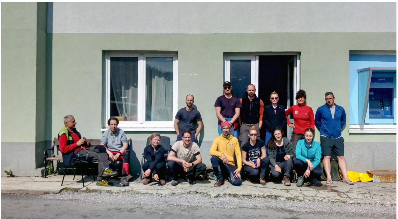
Sudionici mini-ekspedicije Crni Lug 2023.