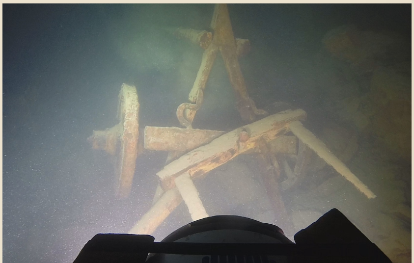
Kola u Sinjcu

godine – 103 metra, a koja je postignuta na ekspediciji „Croatia 99“.