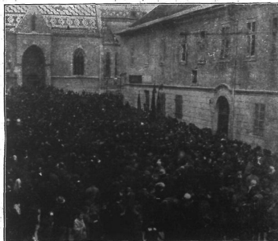
Na Markovom trgu.

Prilog 4. „Izbori i skupštine u Zagrebu“, Dom i svijet , broj 7., 1. travnja 1920., 120.