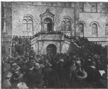
Dačka protestna skupština glade stanova pred sveučilištem.

Na Markovom se trgu skupilo nabrojeno mnoštvo. Crvene zastave su njihovi provodnici. Zarđali su govori — svi o pobjedi. Mnoštvo se stalo spuštati kroz Dugu ulicu na Jelačićev trg, gdje je među »svercerim« nastala strava i cvokot zubi. »Dolje svercerite! više masa i gotovo bi navali, da se ne čuje glas: »Radošević govori — mir!« Nakon govora razdragano se mnoštvo zaboravivši svrcerere razide i uputi u llicu pred crvenu komandu, da još i ondje čuje nešto iz svog novog evanđelja.