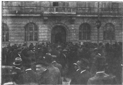
Na biralištu pred trgovačko-obrtnom komorom.