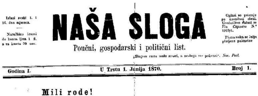
Slika 4. Naša sloga

Odrastajući u slavenskoj obitelji u Istri, položaj Slavena u regiji čiju su političku i intelektualnu elitu činili Talijani obilježio je Dobrila, te je tako svoj život posvetio ujednačavanju životnih prilika Talijana i Slavena. 59 Za vrijeme svojih studija u Beču, Dobrila se sprijateljio s Josipom Jurjem Strossmayerom. To je prijateljstvo značajno utjecalo na njegovo prihvaćanje južnoslavenske ideje koju je nastavio širiti u Istri i Kvarnerskom otočju. 60 Svoje politički stavove Dobrila javno iskazuje 1848. godine, kada se priključuje Slavenskome društvu u Trstu, a 1854. objavljuje molitvenik na hrvatskome jeziku, jedini u Istri, pod nazivom Otče, budi volja tvoja! Molitvena knjiga s podučanjem i naputjenjem na bogoljubno življenje , te time postaje simbolom slavenskoga kulturnog pokreta. U Istarskome pokrajinskom saboru, od osnutka Sabora 1861. godine pa sve do svoje smrti, sudjeluje kao virilni član te pridonosi raspravama pokušavajući izjednačiti položaj Slavena i Talijana. Također je služio na mjestu predstavnika u bečkom parlamentu. Od 1868. godine, nakon što se talijanska većina javno usprotivila sudjelovanju virilnih članova u Saboru, Dobrila prestaje dolaziti na zasjedanja te se okreće drugom načinu narodnog prosvjeda pokretanjem prvih hrvatskih novina u Istri pod nazivom Naša sloga . 61