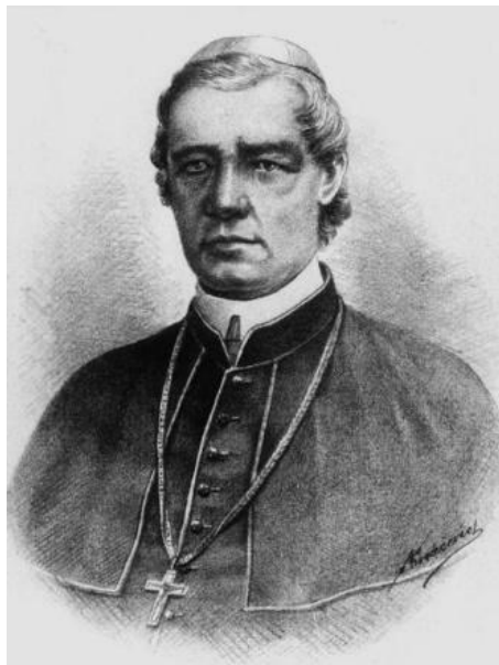
Slika 3. Juraj Dobrila