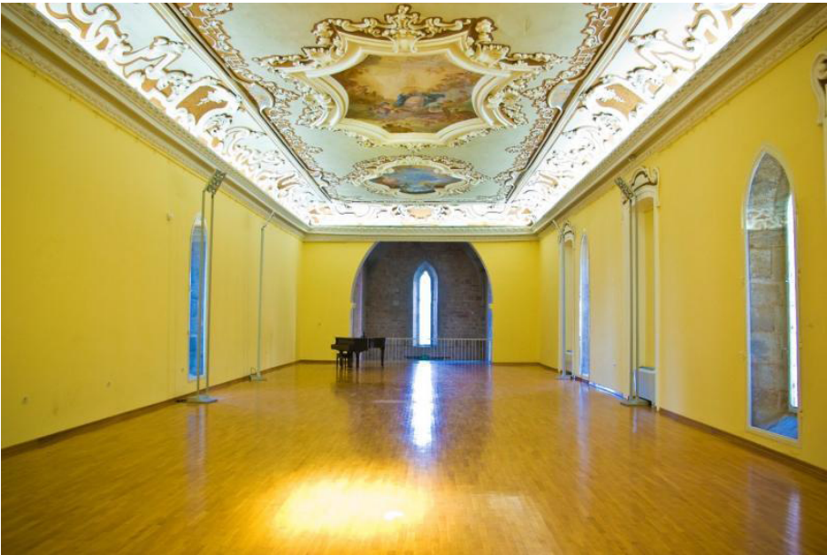
Slika 6. Istarska sabornica

Godine 1861. Polesini prvi put stupa na političku scenu predstavljajući veleposjednike u Istarskome saboru, te postaje njegovim prvim predsjednikom. Četiri je puta izabran za zastupnika u Istarski sabor (1861., 1867., 1870. i 1877. godine), a služio je i kao zastupnik u Carevinskom vijeću. Povrh toga, Gian Paolo Polesini bio je prvi predsjednik Istarskog poljoprivrednog društva, koje je osnovano 1869. godine na njegovu inicijativu te je u više navrata bio načelnik i općinski namjesnik. 73 Još usred trajanja svoga zastupništva u Saboru, Polesini 1882. godine umire te tako završava njegovo djelovanje na društvenom, političkom i gospodarskom planu koje je obilježilo ne samo Poreč, već i Istru kroz 19. stoljeće. Obitelj Polesini ustupila je zgradu Monarhiji u kojoj je zasjedao Istarski sabor, nekadašnju crkvu i samostan svetoga Franje s početka 14. stoljeća. 74