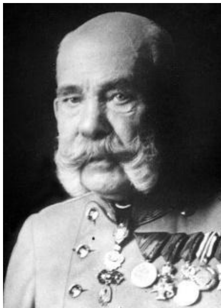
Slika 1. Franjo Josip I.