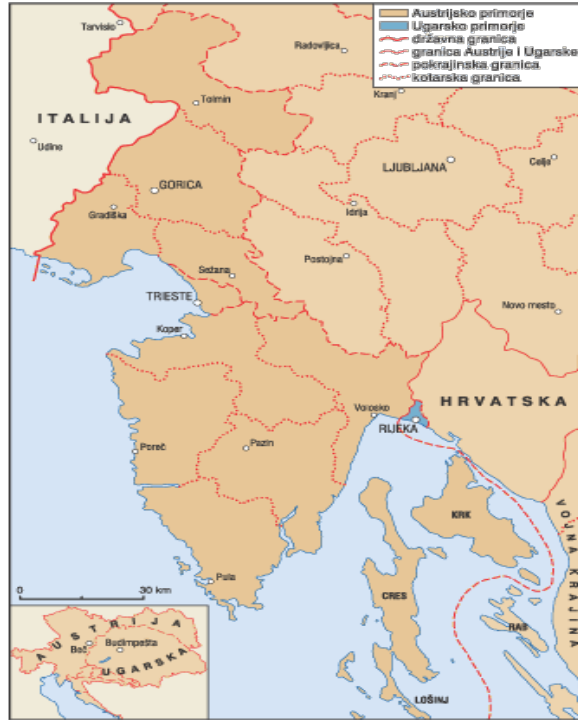
Slika 2. Austrijsko primorje

granice ostale nepromijenjene i nakon krizne 1867. godine kada se provodi Austro-ugarska nagodba te Markgrofovija Istra postaje dijelom cislajtanijskog dijela Monarhije. 11