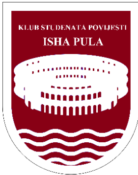
Slika 1. Grb Kluba studenata povijesti ISHA Pula