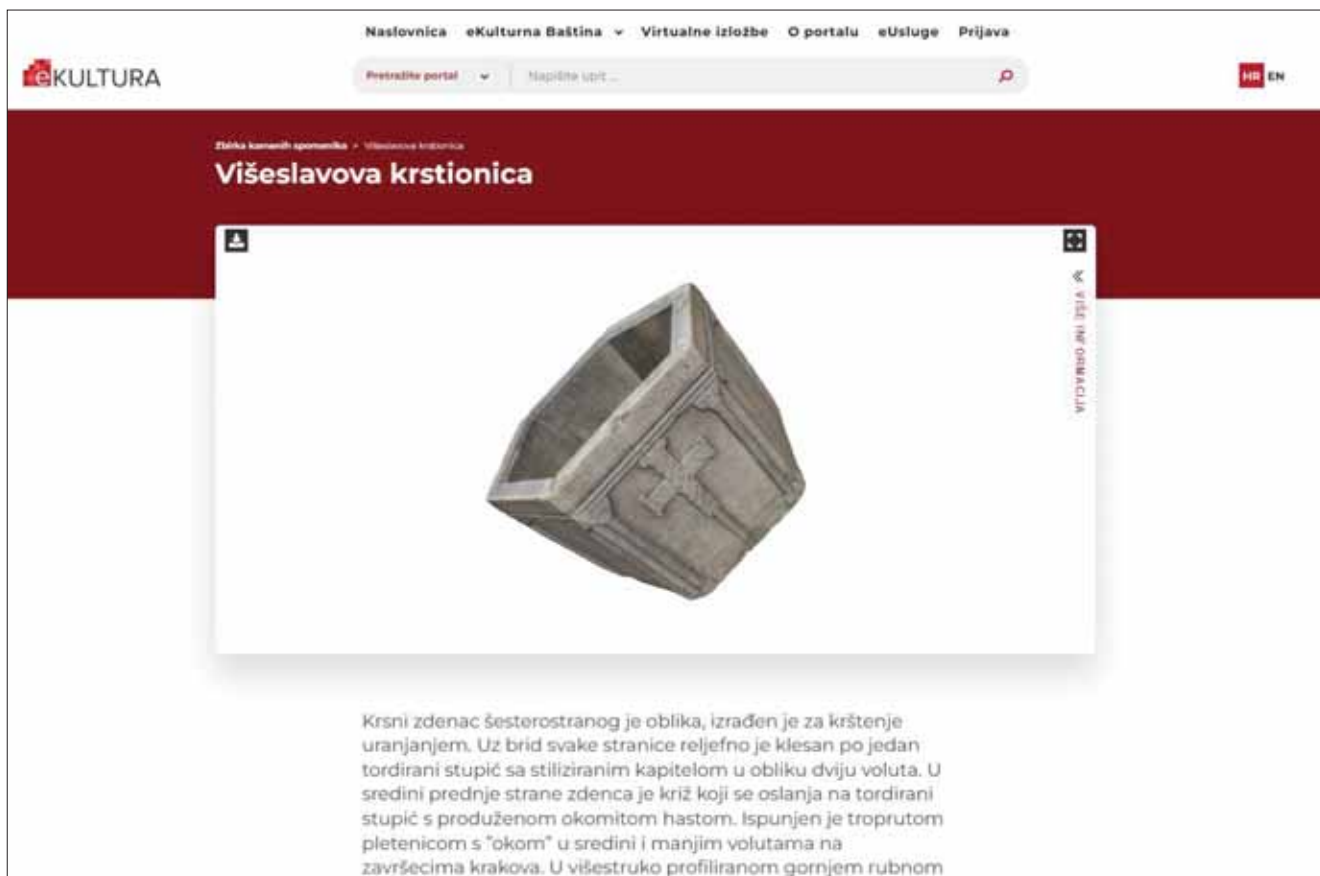
Sl. 5. Digitalna platforma eKultura – prikaz sučelja s 3D prikazom Višeslavove krstionice, Muzej hrvatskih arheoloških spomenika – Split