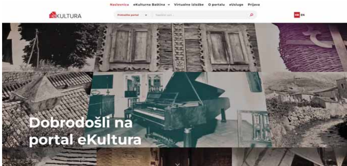
Sl. 1. Digitalna platforma eKultura – sučelje početne stranice