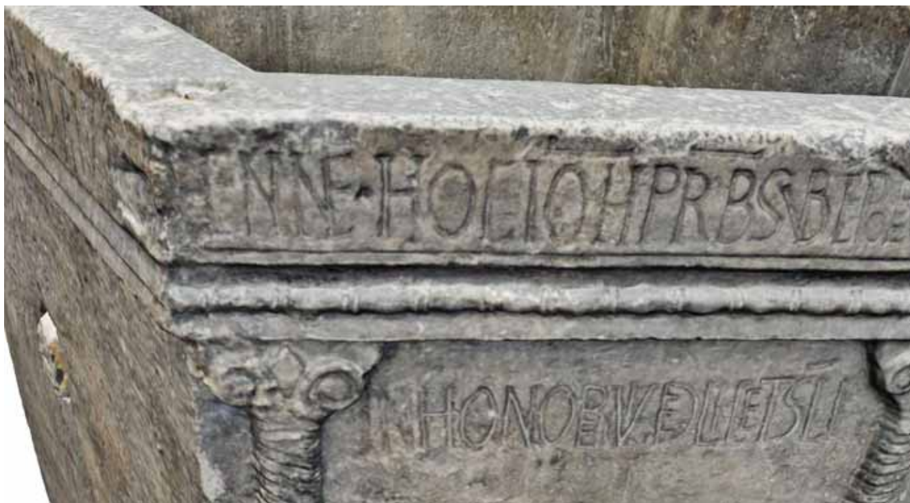
Sl. 6. Digitalna platforma eKultura – prikaz detalja 3D prikaza Višeslavove krstionice, Muzej hrvatskih arheoloških spomenika – Split