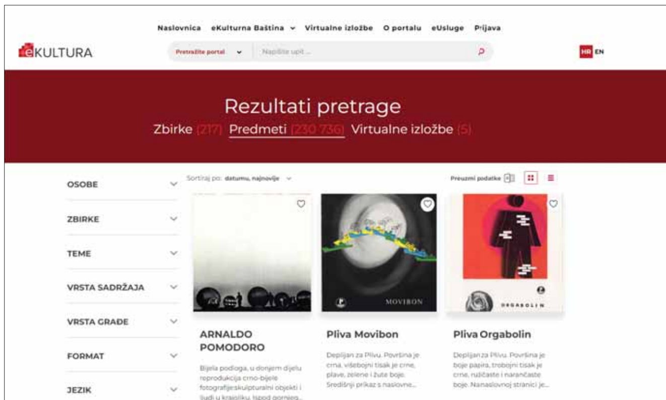
Sl. 3. Digitalna platforma eKultura – prikaz sučelja s brojem zbirke (217), predmeta (230736) i virtualnih izložbi (5) na dan 11. 2. 2024.