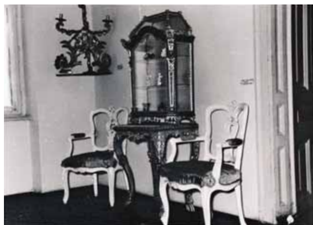
Sl. 2. Stalni muzejski postav, detalj rokoko postava, 1961.