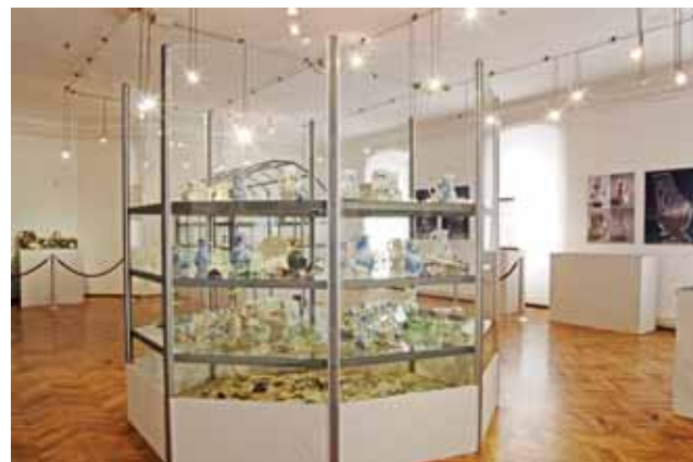
Sl. 4. Izložba Staklo i keramika iz starog franjevačkog samostana, 2005.

suautorica Horvat i Biondić. Predmeti su predstavljeni tijekom 2005. godine uz opsegom manji katalog izložbe u obliku deplijana, a znanstvena istraživanja još su potrajala tijekom izložbe te je vizualno kvalitetno oblikovan i tvrdo ukoričen katalog tiskan 2007. godine. Rezultati predočeni tom izložbom i katalogom stavljeni su u nov kontekst nekoliko izložbi, kao što je Osijek i šira okolica u osmanskome periodu te Tvrđa u Osijeku . 25