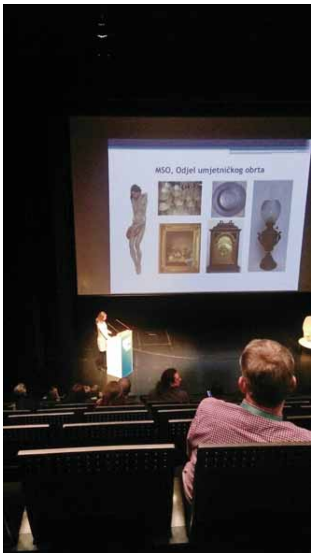
Sl. 7. Institucije povijesti umjetnosti: 4. kongres hrvatskih povjesničara umjetnosti, 2016.

godine u radu Vilene Vrbanić. 34 Umjetnička građa i građa umjetničkog obrta Muzeja Slavonije dopunjuje spoznaje znanstvenica stečene u matičnim muzejskim ustanovama, Muzeju za umjetnost i obrt te Muzeju likovnih umjetnosti, a mlada muzikologinja Vrbanić svoju je doktorsku disertaciju izradila istražujući glazbala umjetničke glazbe u hrvatskim muzejima. Zbirka glazbenih instrumenata Odjela umjetničkog obrta pokazala se kao važna zbirka u kontekstu hrvatskih muzejskih ustanova.