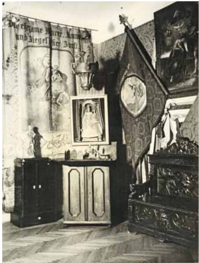
Sl. 1. Stalni muzejski postav, detalj crkvenog postava, 1930-ih.

arheološkog, povijesnog odjela, odjela umjetničkog obrta te knjižnice. 4 Prvih desetljeća muzej je djelovao kao de facto arheološki muzej čiji je jedan od ciljeva bio zaustaviti odnošenje arheoloških nalaza i kamenih spomenika izvan Osijeka, u veće sredine poput Zagreba ili Budimpešte. 5 Iako je nekoliko važnih darova tih prvih godina sadržavalo predmete od fajanse i kositra te su pojedinačni darovi poput lule, narukvice, prstenja ili džepnih satova označili početak prikupljanja predmeta umjetničkog obrta, onodobna dokumentacija i popisi građe pokazuju da je pozornost istraživača bila usmjerena prema numizmatici i arheologiji. 6