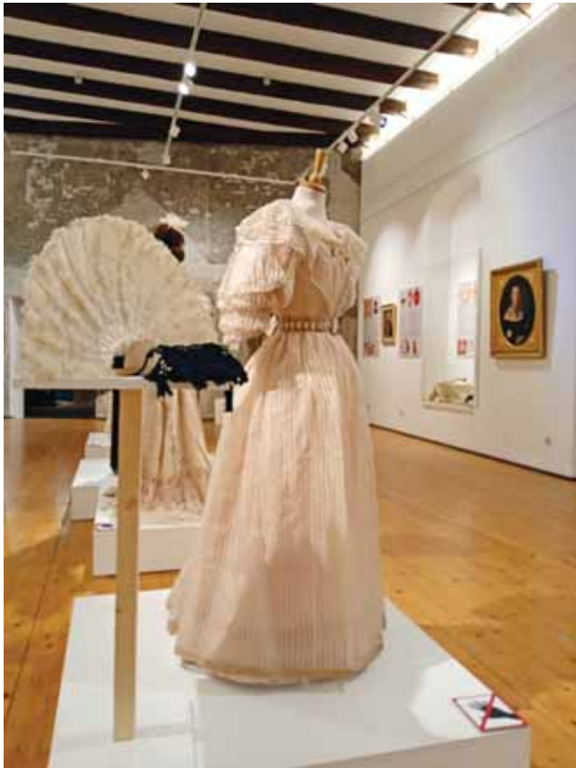
Sl. 5. Izložba U redu za ples , 2022.

Krajem 2022. godine otvorena je izložba U redu za ples: zbirka plesnih redova u Muzeju Slavonije , uz istoimeni katalog izložbe u kojem su predstavljeni rezultati istraživanja kustosice Gabrijele Odobašić kojim je usmjerila pozornost stručnjaka na tu umjetnički i kulturološki vrijednu, no pomalo zanemarenu skupinu umjetničko-obrtničkih predmeta.