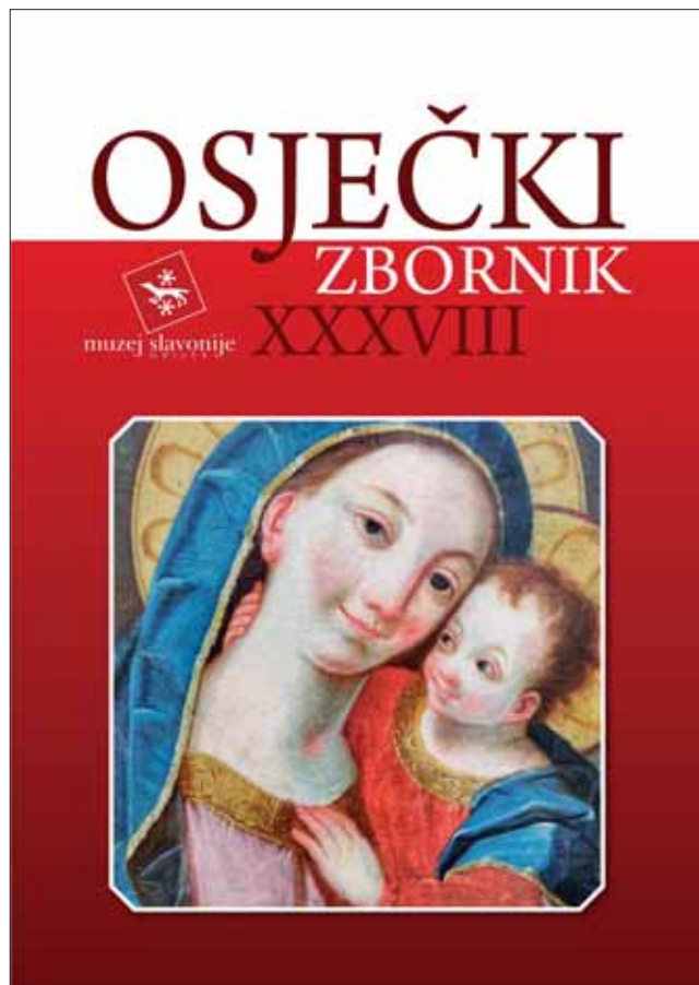
Sl. 6. Osječki zbornik 38(2023), naslovnica časopisa