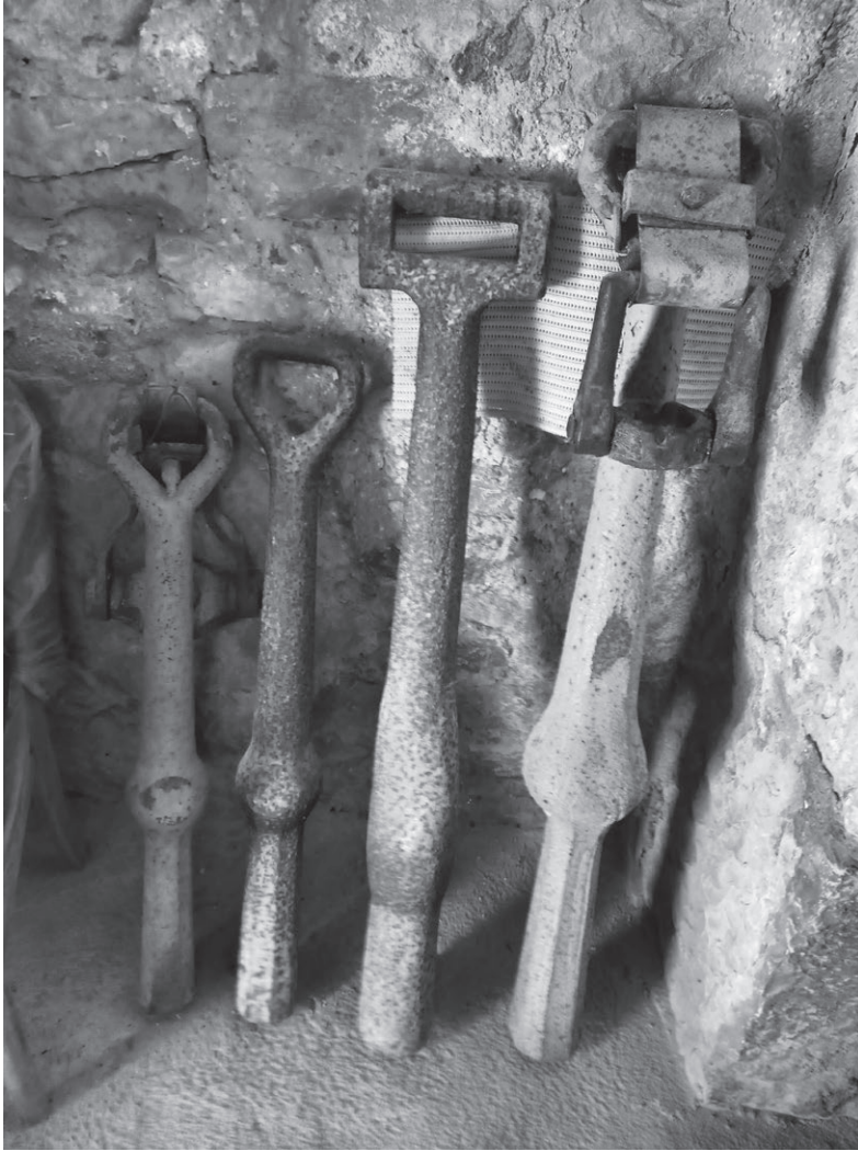
Fig. 2 - I batocchi sistemati lungo il lato di ponente nel vano d'entrata del campanile

per Muggia, per Capodistria, per Isola e altri centri ancora. Entrati, sulla sinistra stanno appoggiati alla parete quattro batocchi/ batòci di campana in ferro 11 .