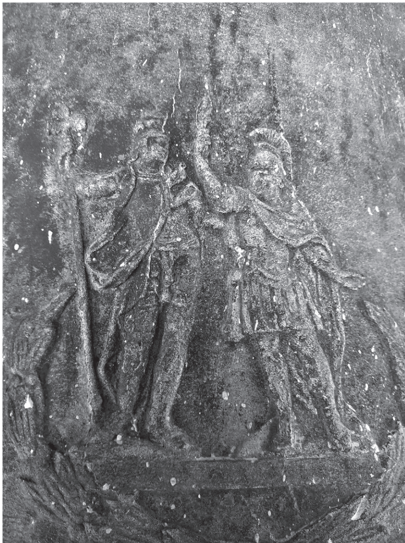
Fig. 1 - A S. Giusto e a S. Servolo è dicato un fregio della campana grande

La chiesa parrocchiale dedicata alla Natività della Vergine venne costruita nel 1336, sui resti di una più antica, risalente all'XI secolo. Restaurata nel 1420, venne ricostruita e ampliata nel 1580 e consacrata nel 1582 dal vescovo Matteo Barbabianca. Ristrutturazioni e restauri furono compiuti nel 1629, 1834, 1927 – 34 e nel 1974. La chiesa, tutta in pietra viva, ha una bella facciata con la parte centrale più alta conclusa a triangolo, con due campaniletti a vela ai lati. Sopra il bel portale con decorazione a timpano, è collocato il leone marciano proveniente dal rivellino della porta di S. Fior. Ancora più in alto il rosone trecentesco con archetti gotici.