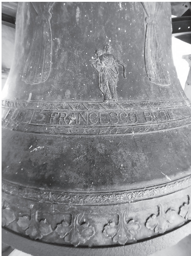
Fig. 5 - Particolare del fianco della campana piccola fusa da Francesco Broilli