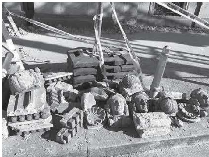
Slika 18. HUD – demontaža arh. plastike, autorica Š. Batinić, 2020.

u 2020., koja će nakon obnove zasigurno doživjeti preinake. Jednako tako posljednji put dokumentiraju segmente stalnoga postava HŠM-a iz 2000. jer je građa nakon toga izmještena u depoe iz sigurnosnih razloga (sl. 17).