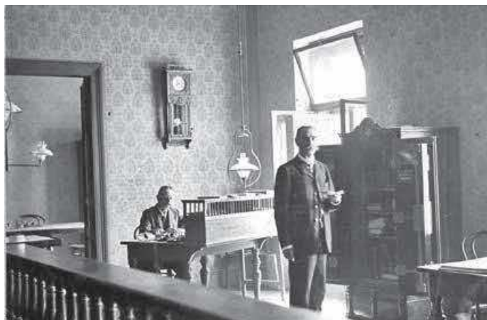
Slika 8. HUD – prostorija Hrvatske učiteljske štedne zadruge, 1899. (inv. br. HŠM Mf 353)