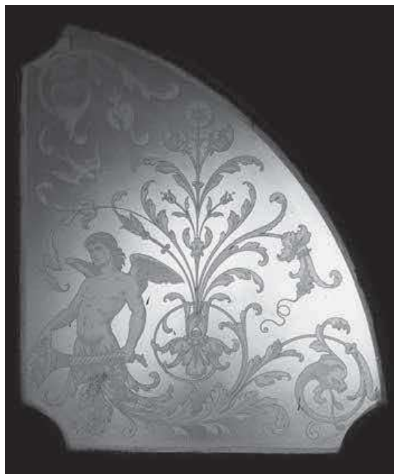
Slika 16. HUD – detalj stakla nad vratima, autor F. Fijačko, 2020.

Fotografije Milana Pezelja nastale su prilikom posjeta stručne skupine Ministarstva kulture i medija Republike Hrvatske neposredno nakon potresa, 8. travnja 2020. Fotografije bilježe oštećenja zgrade na uličnim i dvorišnim fasadama i u interijeru na svim etažama. Te fotografije ostaju trajna dokumentacija povijesnoga identiteta zgrade