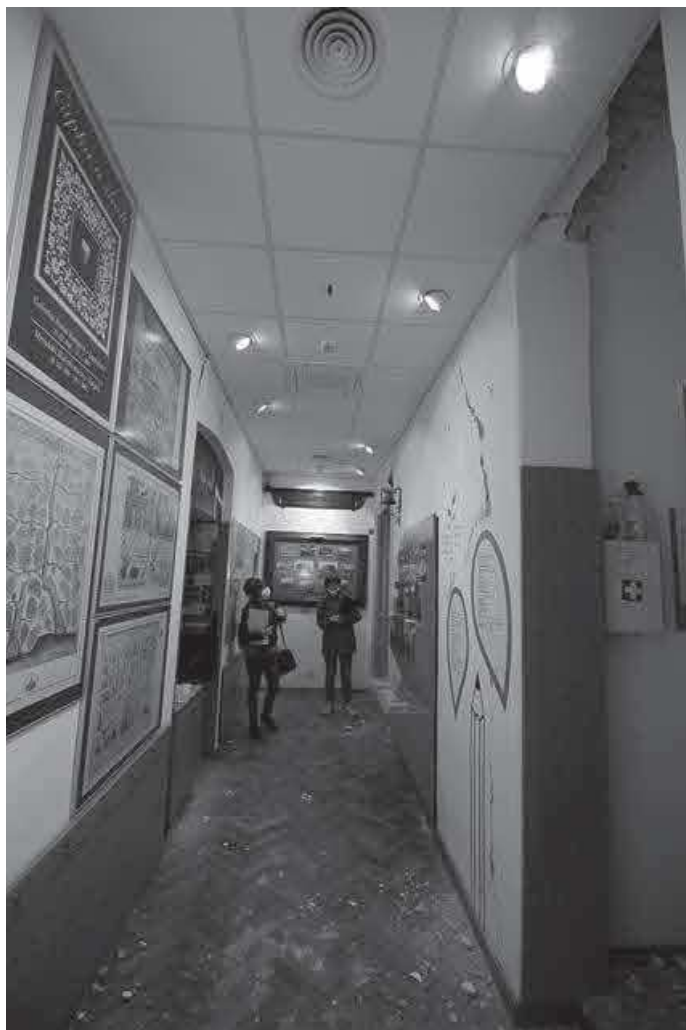
Slika 17. HŠM – detalj postava nakon potresa, autor M. Pezelj, 2020.