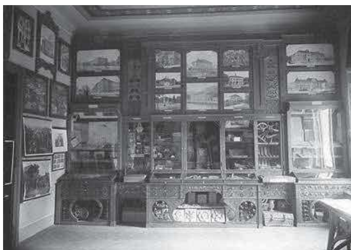
Slika 10. HŠM, 1. postav, 1901. (inv. br. HŠM Mf 365)