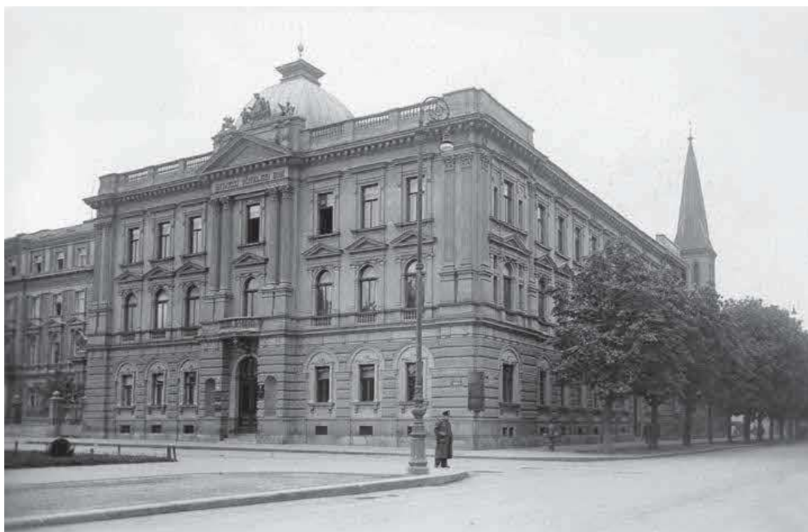
Slika 6. HUD – razglednica, 2. svj. rat (inv. br. HŠM Mf 399)