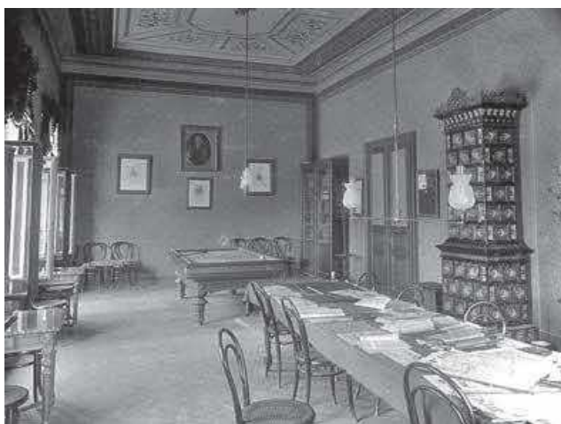
Slika 7. HUD – velika dvorana, 1901. (inv. br. HŠM Mf 489)

Dijelove izvornoga unutrašnjeg uređenja prikazuju fotografije velike dvorane HUD-a (sl. 7), one na kojima su prostorije Hrvatske učiteljske štedne i predujamne zadruge