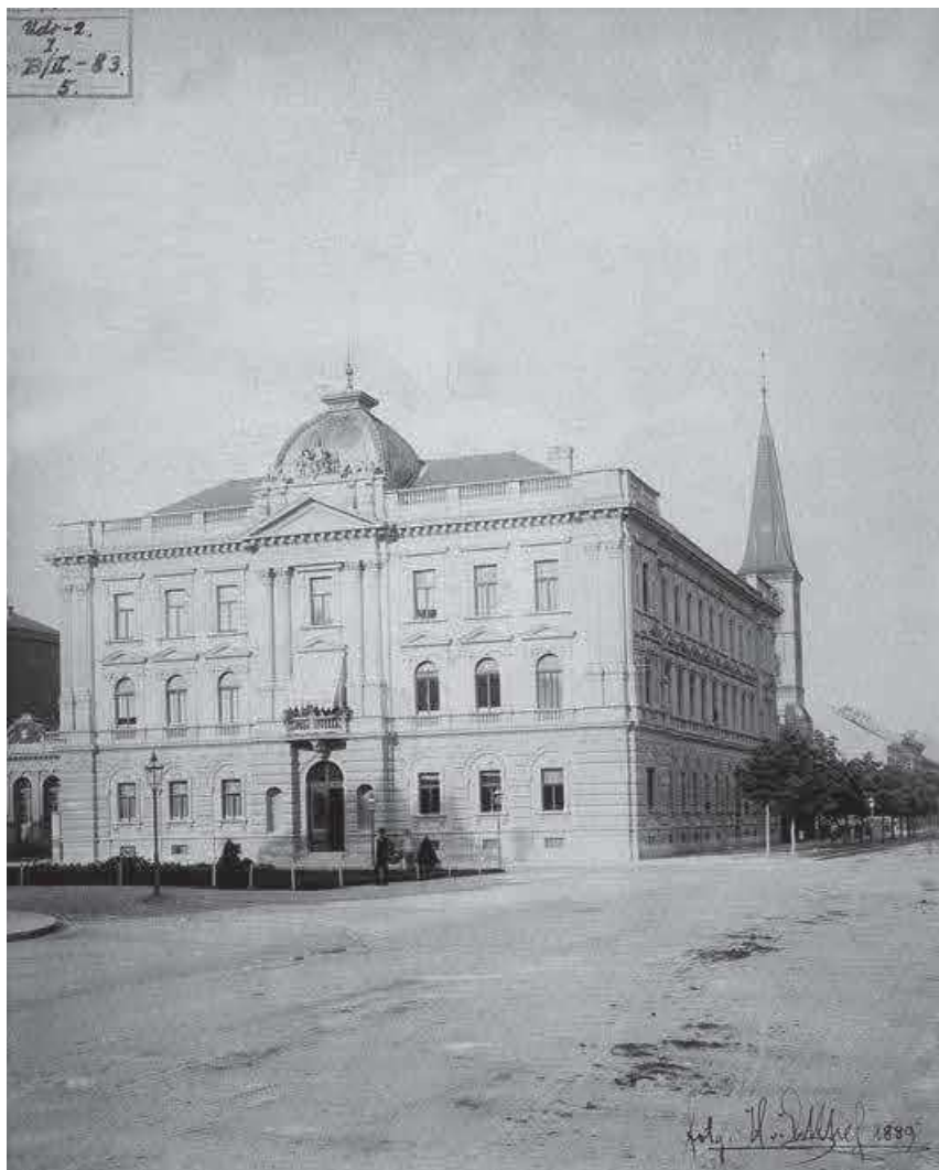
Slika 1. HUD – zap. pročelje, autor J. Winkler, 19. st. (inv. br. HŠM Mf 396)

Razglednice u Zbirci datiraju od druge polovine 19. stoljeća do suvremenosti. U najvećem broju zastupljene su one s motivom školskih zgrada gradova i mjesta diljem Hrvatske (Serdar, 2021b). Kao dijelovi gradskih vizura, na razglednicama se prezentiraju važne kulturne i obrazovne ustanove, odnosno njihove zgrade, što svjedoči o obrazovnoj ulozi koju su imale razglednice. Upravo takva bila je i uloga razglednica s motivom HUD-a, kojih u Zbirci imamo devet. Razglednice s motivom HUD-a datiraju od prvoga desetljeća do sredine 20. stoljeća. Većina ih je anonimna, a jedini identificirani autor je E. Marton (sl. 3, inv. br. 32799) te nakladnici M. Jaklin (sl. 4, inv. br. 33167) i V. Tomlinović (sl. 5, inv. br. Mf 398).