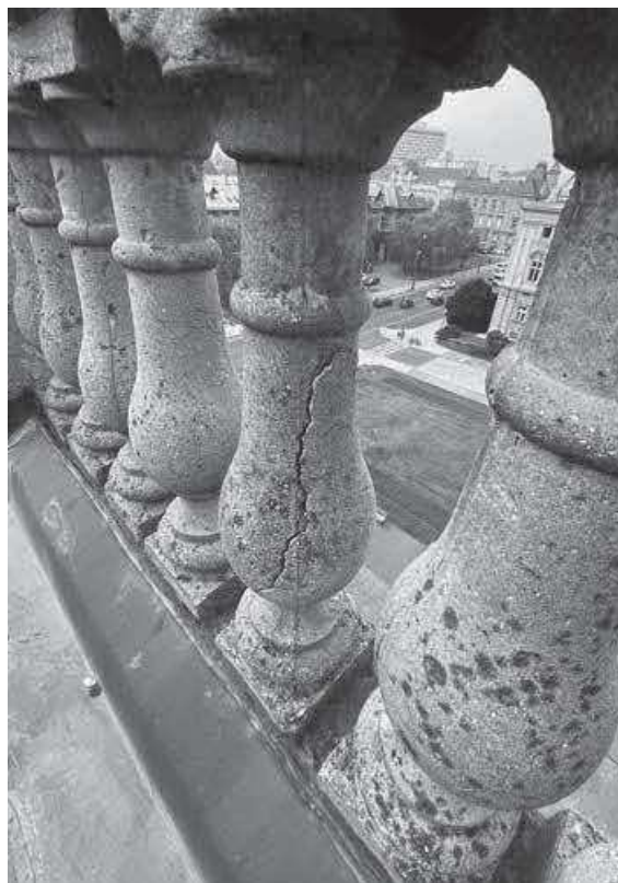
Slika 13. HUD – potres, oštećenje krovne balustrade, 2022.