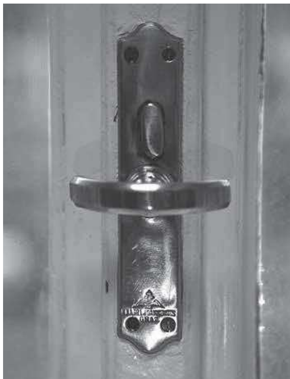
Slika 14. HUD – detalj, bravarija Joanowics, autor F. Fijačko, 2020.