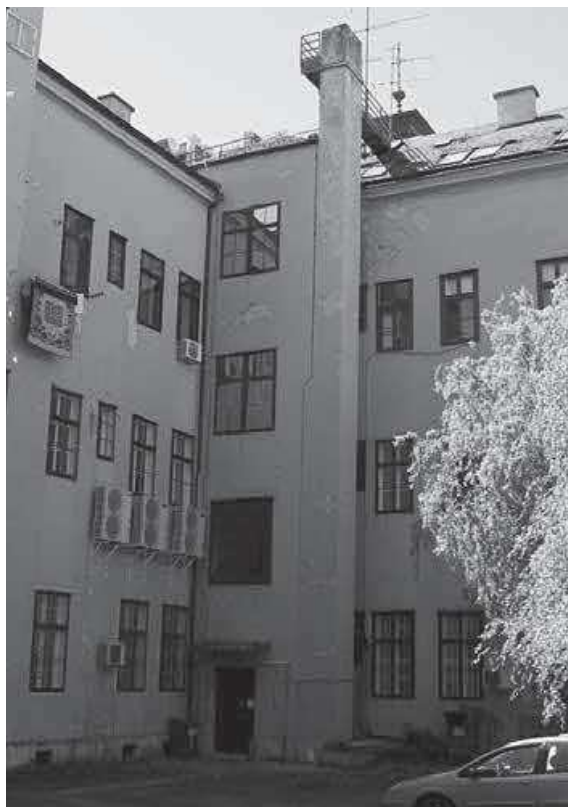
Slika 12. HUD – potres, oštećenje dimnjaka, autor M. Pezelj, 2020.