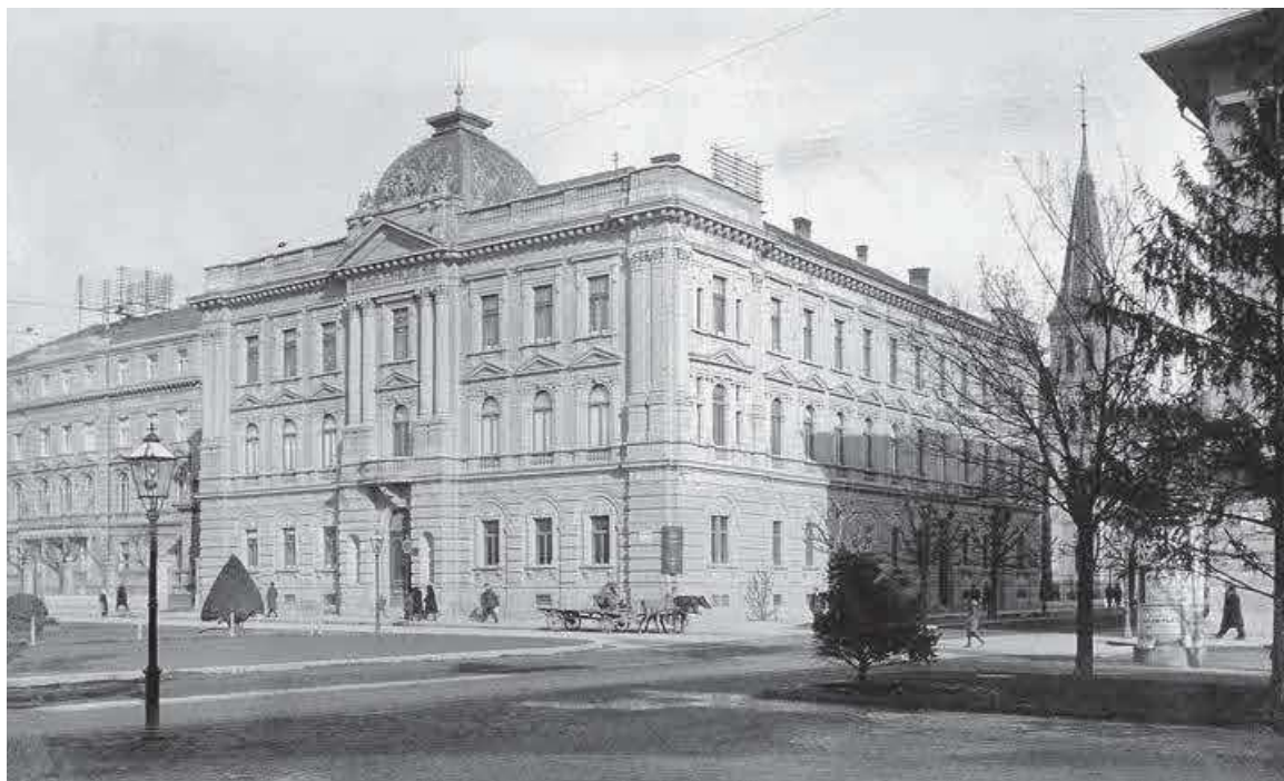
Slika 5. HUD – razglednica, nakladnik V. Tomlinović, prva polovina 20. st. (inv. br. HŠM Mf 398)