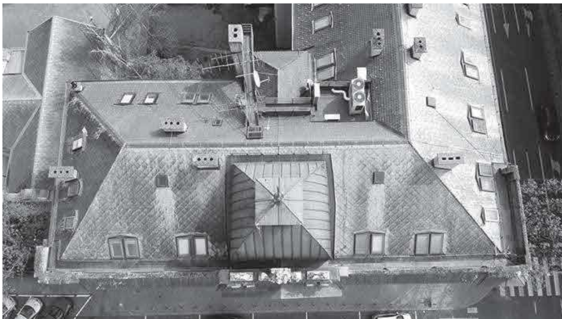
Slika 19. HUD – krov, autor D. Bračić, 2020.