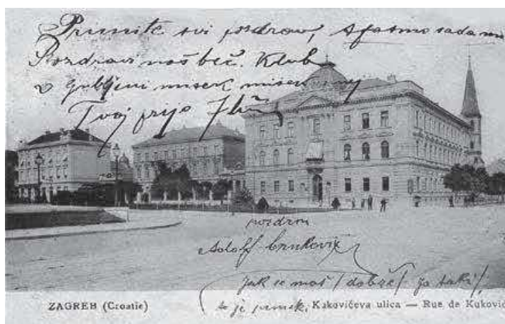
Slika 4. HUD – razglednica, nakladnik M. Jaklin, 1905. (inv. br. HŠM 33167)