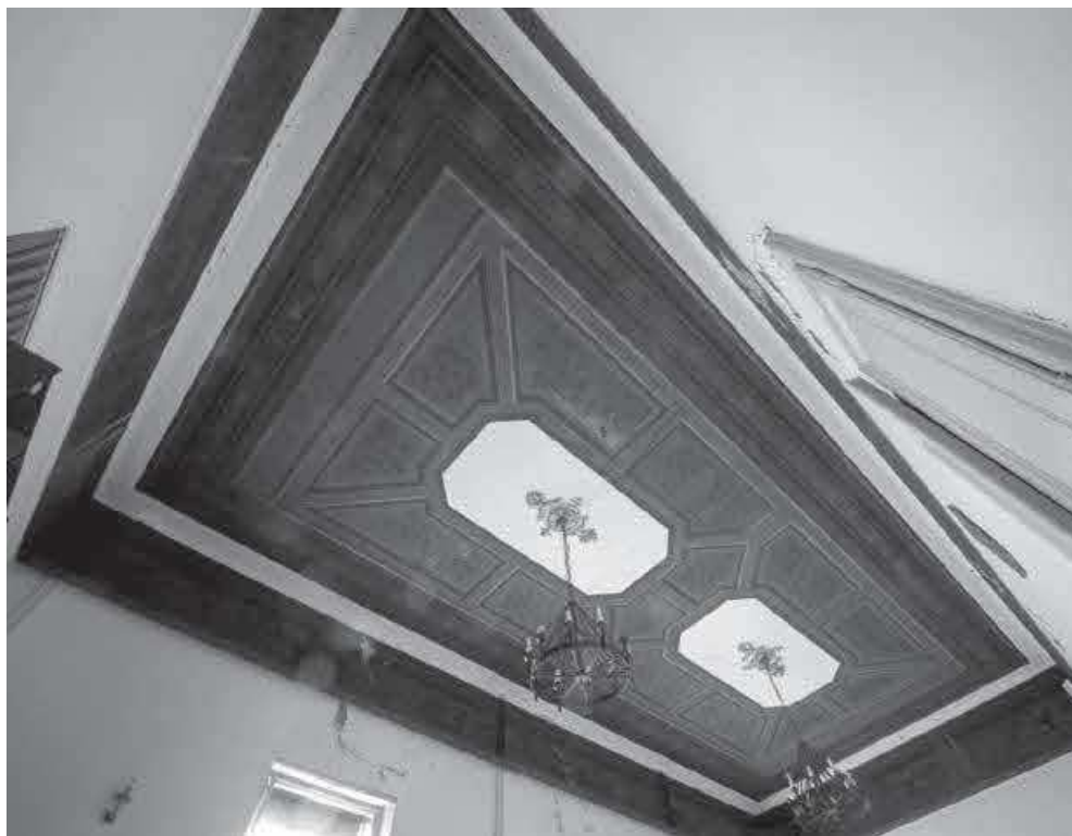
Slika 11. HUD – strop velike dvorane, autor F. Fijačko, 2023.

(sl. 8) i Gospojinskoga kluba učiteljica (sl. 9) te one koje dokumentiraju prvi stalni postav HŠM-a 1901. (sl. 10). Fotografije su datirane u zadnje godine 19. ili prve godine 20. stoljeća. Strop velike dvorane u prizemlju koja je služila za okupljanja ima stropni ornamentalni oslik koji je i danas očuvan. Usporedimo li njegov današnji izgled s onim na crno-bijeloj fotografiji s kraja 19. stoljeća, primijetit ćemo da je izvorni oslik bio nešto svjetliji i s jačim kontrastima (sl. 11). Tragove oslika naziremo mjestimično i na drugim zidovima, koji su razotkrili svoje dublje slojeve uslijed oštećenja u nedavnim potresima. Prema fotografijama prvoga postava Muzeja, u srednjoj sobi prvoga kata smještenoj iznad ulaza strop je bio dekoriran oslikom (sl. 10). Može se pretpostaviti da je zidne oslike moguće naći i na drugim, zasad neidentificiranim mjestima.