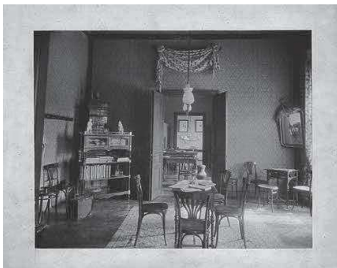
Slika 9. HUD – Gospojinski klub, 1901. (inv. br. HŠM Mf 490)