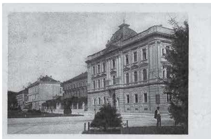
Slika 3. HUD – razglednica, autor E. Marton, 1. pol. 20. st. (inv. br. HŠM 32799)