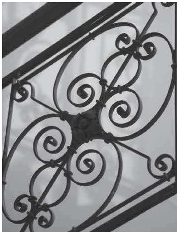
Slika 15. HUD – detalj ograde stubišta, autor F. Fijačko, 2020.