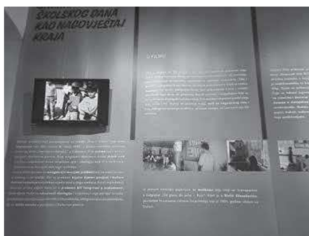
Izložba Pioniri maleni