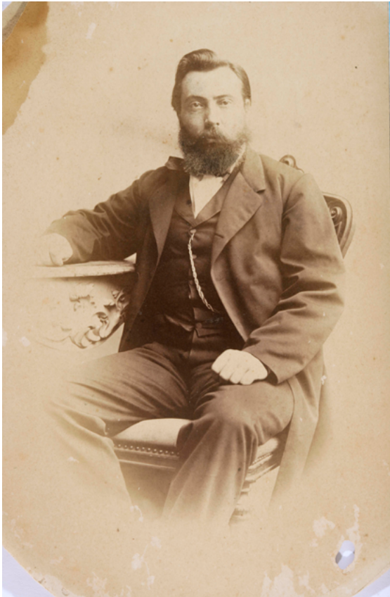
Sl. / Fig. 2 Baltazar Bogišić, nepoznati fotograf, Beč, oko 1865., Zbirka Baltazara Bogišića HAZU-a / Baltazar Bogišić, unknown photographer, Vienna, around 1865, the Baltazar Bogišić Collection at the Croatian Academy of Sciences and Arts)

Uz nabrojene znanstvene doprinose, dosad je nedovoljno uočeno njegovo zanimanje za muzeologiju. Iz ovog područja napisao je dva rada. Prvo naslova O preuredjenju narodnoga Muzeja u Zagrebu objavljeno je u Zagrebu 1866. , a sljedeće godine objavljuje „Slovenski muzeum. Misli o potrebi naučnoga središta sa svakolika slovenska plemena” u Srpskom letopisu Matice srpske u Novom Sadu. 17 Upravo u