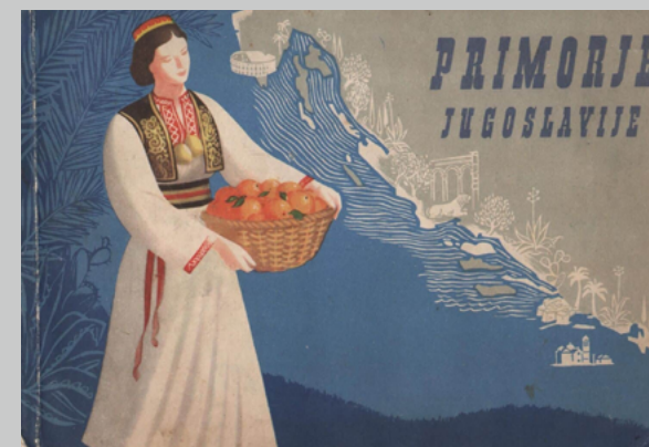
Sl. / Fig. 2 Naslovnica ilustriranog turistiĉkog vodiĉa istoĉne obale Jadrana. Ćuĉiĉ, Jerko (ur.) Primorje Jugoslavije — Pregled turistiĉkih i kupališnih mjesta , 1952. / Cover of the Illustrated Tourist Guide of the Eastern Adriatic Coast.