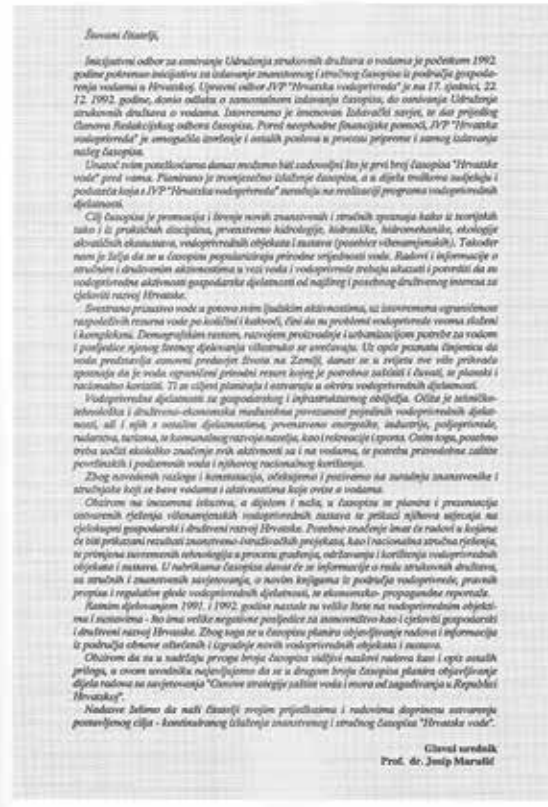
Slika 2: Uvodnik prvog broja časopisa "Hrvatske vode", Josip Marušić

urednika Ljudevit Tropan, dipl. ing. građ. JVP Hrvatska vodoprivreda je omogućila izvršenje aktivnosti i poslova u procesu pripreme i samog izdavanja časopisa Hrvatske vode. U skladu s provedenim natjecajem, poslove grafičkog uređenja i pripreme za tisak obavljao je Press Trade, Zagreb, a poslove tiskanja časopisa MTG - Consalting, Velika Gorica.