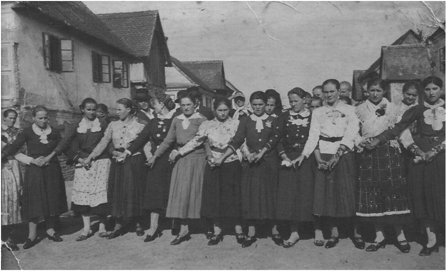
Slika 3: Šetano kolo u Davoru početkom četrdesetih godina 20. stoljeća, najvjerojatnije za blagdan Velike Gospe (nepoznat autor)