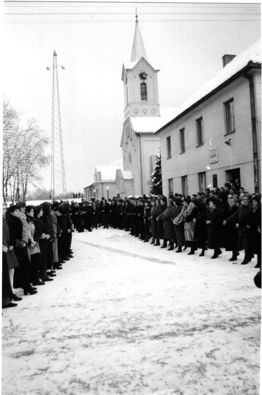
Slika 4: Božićno šetano kolo u Davoru 1995. godine, poslije božićne “velike” mise (autor: Anka Dević)