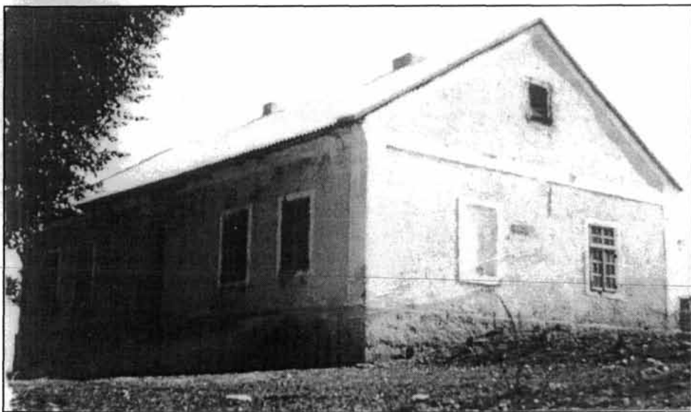
Sl. 1. Zgrada osnovne škole u Vratniku do godine 1965.

Prema jednom ciljanom upitniku provedenom sedamdesetih godina ovoga stoljeća, na području Vratnika najstariji se mještani prisjećaju pripovijedanja da je školska zgrada izgrađena godine 1872. s desne strane ceste od Senja prema Žutoj Lokvi, nekih 200 metara zapadno od današnjega Društvenog doma. Zgrada