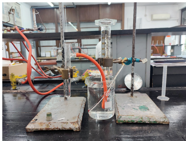
Slika 2 – Aparatura za određivanje debljine aluminijske folije za domaćinstvo prije provedbe eksperimenta

Nakon što je složena aparatura pristupa se izvedbi pokusa. Smotuljak aluminijske folije ubaci se u epruvetu za odsisavanje, u kojoj se nalazi otopina klorovodične kiseline te se epruveta odmah zatvori gumenim čepom. Učenici opažaju da se nešto događa u epruveti za odsisavanje, uz zaključak da je riječ o kemijskoj reakciji. Uočljivo je nastajanje mjehurića, što je pokazatelj da se pri kemijskoj reakciji oslobađa plin. Vrlo često učenici sami zaključke da bi to trebao biti vodik. Doticanjem stjenke epruvete za odsisavanje može se primijetiti da se epruveta zagrijala, te iz toga