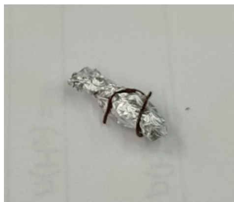
Slika 1 – Uzorak aluminijske folije za domaćinstvo omotan bakrenom žicom

Sastavi se aparatura prema prikazanom na slici 2. Epruveta za odsisavanje pričvrsti se na metalni stalak i u nju se ulije 10 ml klorovodične kiseline (1 : 1). U čašu od 600 ml ulije se otprilike 450 ml vodovodne vode. Zatim se vodovodnom vodom do vrha napuni menzura, a na vrh se stavi filterski papirić malo veći od otvora menzure. Menzura se preokrene i uroni u čašu s vodom. Menzura je u potpunosti ispunjena vodom. Gumena cijev sa staklenim nastavkom spoji se na epruvetu za odsisavanje a potom se stakleni nastavak umetne u menzuru pazeći da pritom u menzuru ne uđe zrak. U čašu s vodom postavi se termometar i ostavi tamo