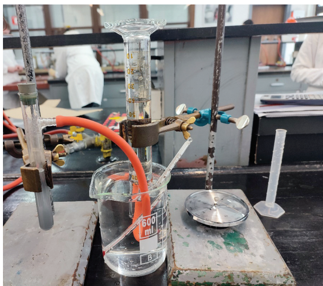
Slika 3 – Prikaz razina otopina nakon provedbe eksperimenta

Kad sam posljednji put s učenicima provodila ovaj eksperiment, učenici su očitali sljedeće podatke: volumen oslobođenog vodika bio je 40 ml, temperatura je iznosila 20 °C, atmosferski tlak 101 410 Pa, a razlika u razinama vode ( h ) 7 cm. Iz tablica je očitano da je pri 20 °C tlak vodene pare 2333 Pa, a gustoća vode 998,2 kg m -3 .