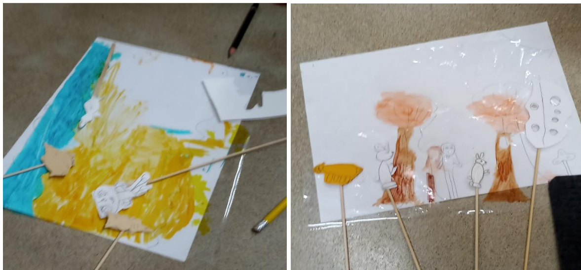
SLIKA 6,7- NAPRAVITE LUTKE U SJENI

Dobili su materijal za izradu lutke, nacrtali su lutku na tvrdom kartonu i izrezali je. Bila je zalijepljena za drveni štap ljepljivom trakom.