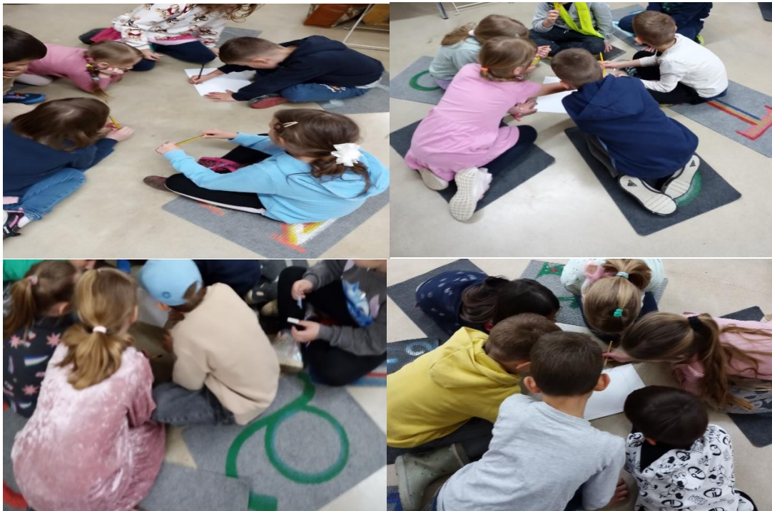
SLIKA 2,3, 4,5 - CRTANJE PROSTORA DOGAĐAJA

Prvo su u grupama razgovarali o temi svoje priče. Tada su morali nacrtati akcijski prostor.