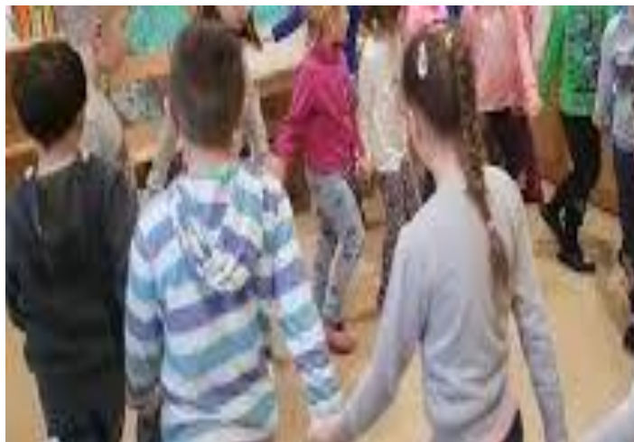
SLIKA 16- Suosjećamo s glazbom

U glazbenoj umjetnosti okušamo se i u slušanju raznih melodija i plesu.