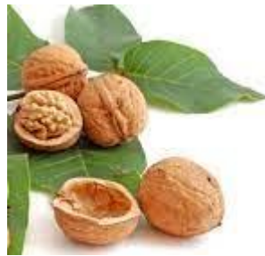
SLIKA- 6- Orehove lupinice