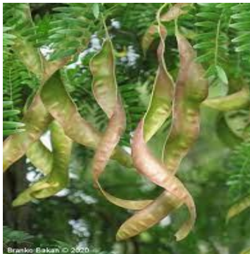
SLIKA 8- Mahune lopatica