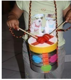
SLIKA 12- Bubanj