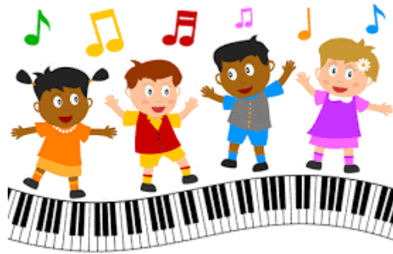
SLIKA 1- Pjevam i prelazim preko glazbe

Zvučno okruženje je poput džungle za djecu, puno avantura koje ponekad postanu neočekivano komplicirane i, na veliko iznenađenje, rasplet. Putuju kroz njega brzo, polako, sami ili s prijateljima. Istodobno se sjećaju mnogih različitih zvukova i zvučnih uzoraka koje ne znaju odmah ponoviti. Ali oni mogu pouzdano pokazati koliko im je lijepo sa svakim zvukom, ako nije preglasan ili previše nametljiv. Opisat ću neke takve glazbene aktivnosti- didaktičke igre koje izvodim u glazbenoj umjetnosti u školi u razredu.