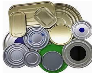
SLIKA 2- Zvona za bicikle SLIKA 3- Čavli SLIKA 4- Poklopci limenki