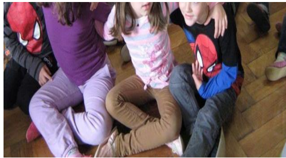
SLIKA 15- Kviz

U glazbenoj umjetnosti okušavamo se i u rješavanju glazbenih zagonetki.