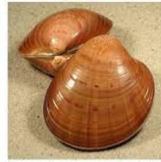
SLIKA 7- Školjke