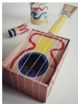
SLIKA 11- Brenkalo