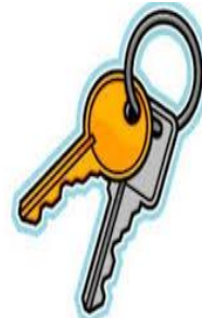
SLIKA 10- Tipke