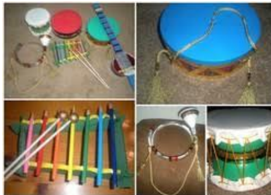
SLIKA 14- Samostalni instrumenti

U učionici smo posvetili mjesto gdje smo udomili instrumente koje smo sami napravili.