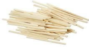
SLIKA 5- Paličice