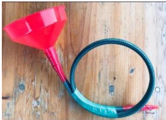
SLIKA 13- Pihalo

To uključuje instrumente koje upuhujemo ili pjevamo na tu. To su različite flaute, izrađene od različitih materijala.