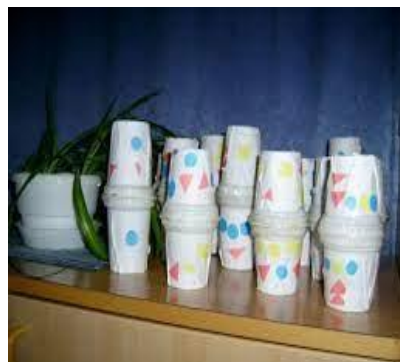
SLIKA 9- Tutnjava iz plastičnih boca