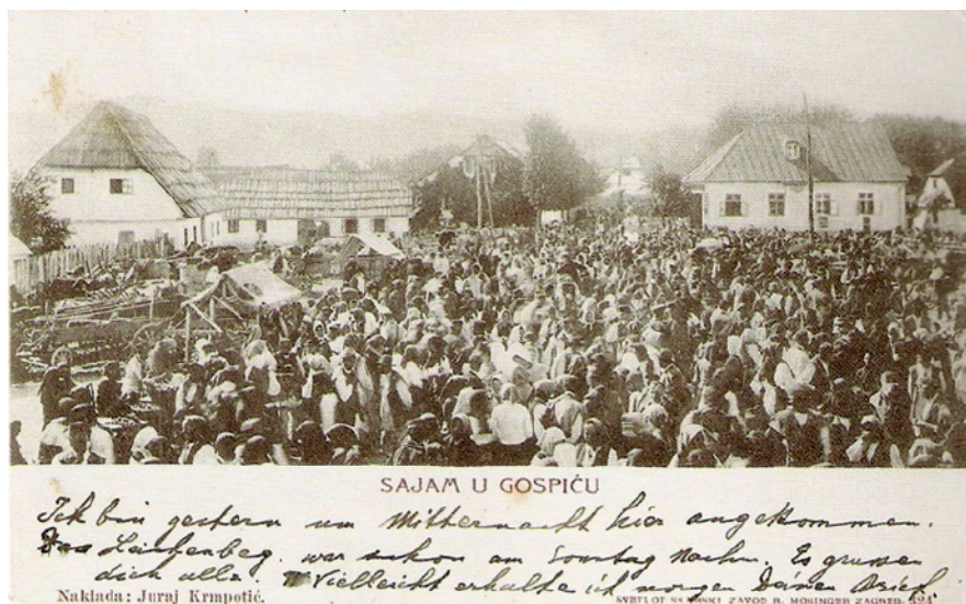
Razglednica „Sajam u Gospiću“ 1903. godine

Odluci bilo navedeno da se na sajmovima mora spriječiti svako eventualno kršenje reda i mira (Vrkljan 2022).