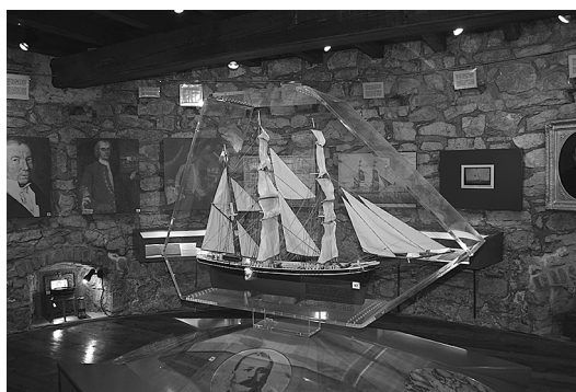
sl.14. Muzejski prostor Kula, Veli Lošinj