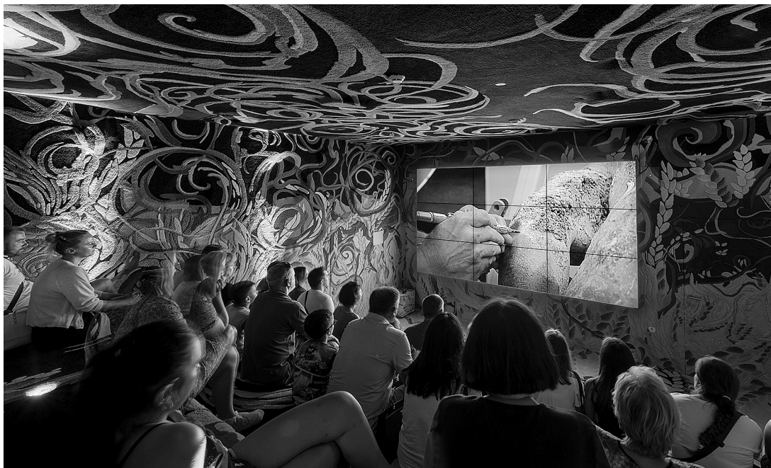
sl.24. Muzej Apoksiomena.