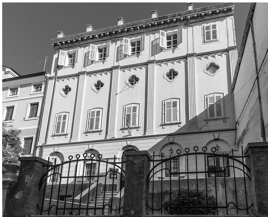
sl.1. Lošinjski muzej, Palača Fritzi, Mali Lošinj

ZRINKA ETTINGER STARČIĆ □ Lošinjski muzej, Mali Lošinj