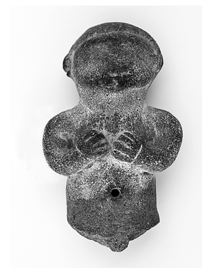
sl.3. Pogled na dio stalnog postava, Lošinjski muzej