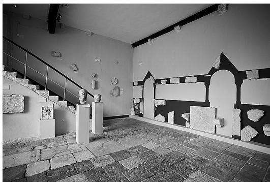
sl.17. Arheološka zbirka Osor, Osor