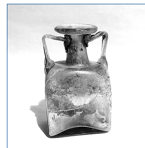
sl.18. Blagajna, sred. 20. st., Zbirka varia