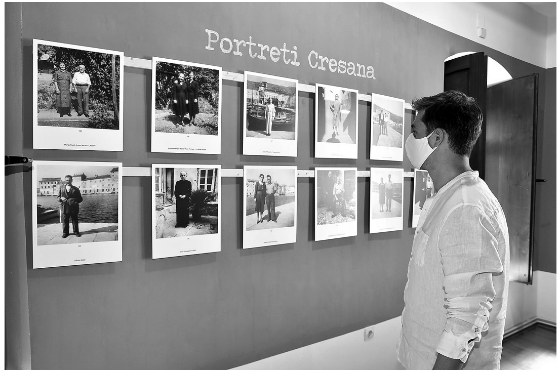
sl.4. Izložba Cres Memory Project (2020.) spajanjem fotografija iz 1951. koje je snimila creska „Merikanka“ za vrijeme posjeta domovini s imenima i sudbinama Crešana na fotografijama dala je presjek jednoga zaboravljenog vremena.