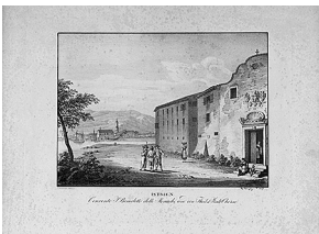
sl.13. Ottavo di Scudo della Croce, 1631., Numizmatička zbirka