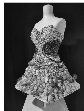
sl. 8.-10. Gostujuća izložba Prirodoslovnog muzeja Rijeka Blago pod površinom Kvarnera – mekušci u kvarnerskom podmorju postavljena je u Creskom muzeju.