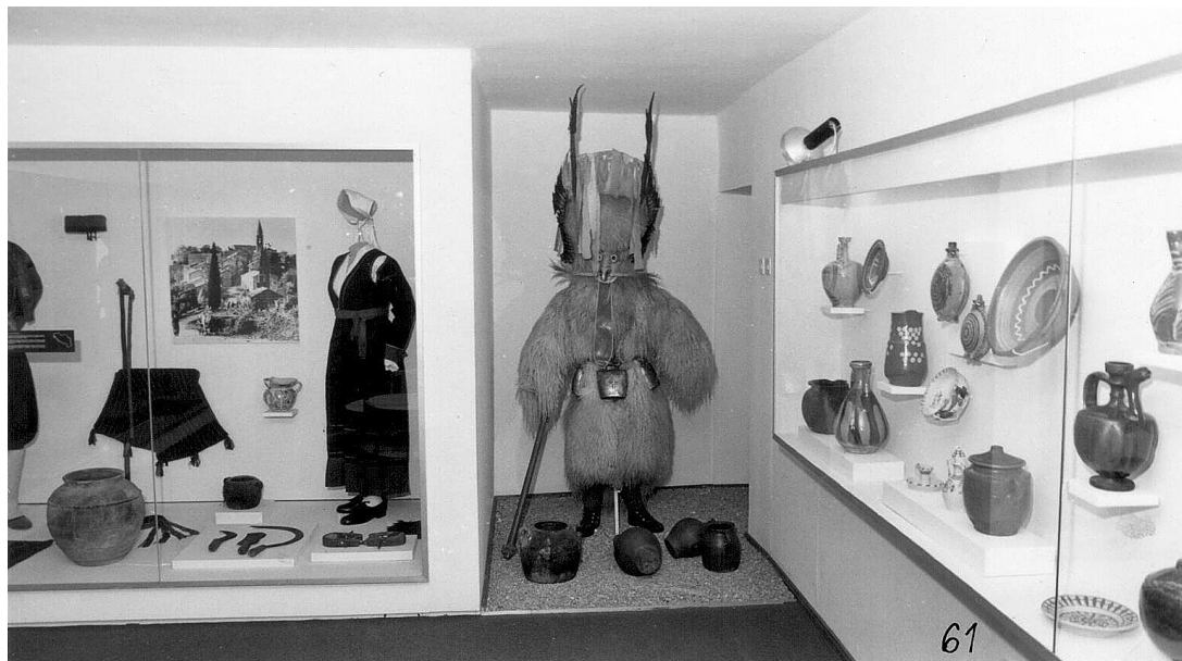
sl.10. Etnografska izložba otvorena 1978. u Vili Pavi