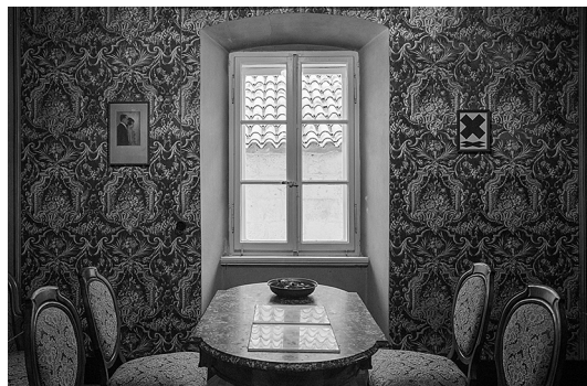
sl.3.-6. Dio stalnog postava Kuće Dobrović u Jelsi.