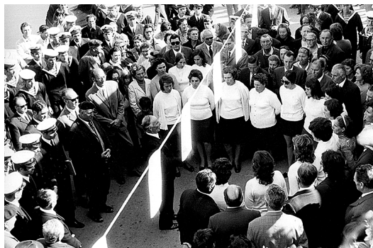
sl.2. Nastup zbora i slavlje u povodu otvorenja Ribarske zbirke 1972., Muzej općine Jelsa

Nakon raspuštanja Centra općini Jelsa predane su Ribarska zbirka (sl.1.-2.) smještena u kući Dežulović u Vrboskoj i Vinogradarska zbirka sa Spomen-sobom NOB-a u zgradi nekadašnje škole u Pitvama.