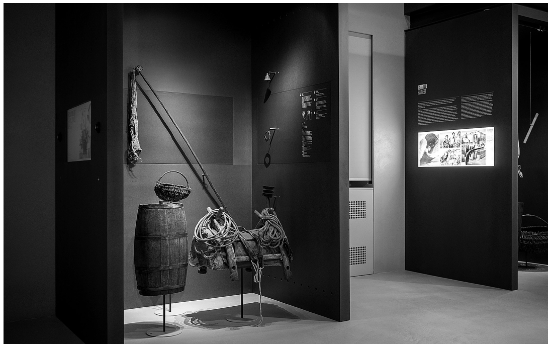
sl.10. Otvorenje novoga stalnog postava Vinogradarske zbirke u Pitvama 28. veljače 2023., Muzej općine Jelsa.