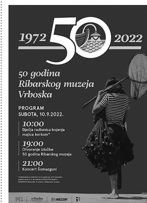
sl.11. Dio postava Ribarske zbirke u kući Dežulović, Vrbovka, Muzej općine Jelsa