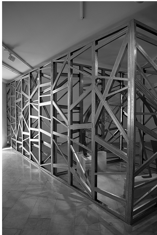
sl.15. Izložba Snježane Ban „Poruke u boc“ priređena u okviru suradničkog projekta Katamaran Art 2022. Muzeja općine Jelsa i Galerije umjetnina Split.