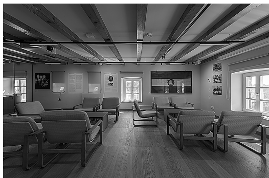
sl.19. Pogled na izvornu kuhinju u sjevernom dijelu potkrovlja palače Gabriellis

U dalmatinskim kućama kuhinje su se tradicionalno nalazile u potkrovlju radi boljeg prozračivanja i veće svjetlosti te zbog drvenih međukatnih konstrukcija. Ambijentalna je kuhinja jedan od najatraktivnijih muzejskih prostora. Opremljena je starinskim namještajem, kuhinjskim posuđem i priborom, a sačuvano je i ognjište – komin. Upotrebom vrste posuda kakva je izložena u kuhinji i prezentacijom na ekranu prikazana je priprema tipične mediteranske hrane koja se danas nalazi na UNESCO-ovoj listi zaštićene nematerijalne baštine. U kuhinji su dvije zidne niše. Unutar niše ugrađene u zapadnom zidu sačuvana je klesarskim ukrasima dekorirana kamena škafa – nekadašnji sudoper. Blizu nje, u južnom zidu, nalazi se niša u kojoj su nužnik i starinska noćna posuda. Niša s nužnikom okrenuta je prema gradskoj kanalizaciji koja se još od srednjeg vijeka pružala između dva niza kuća i kroz koju su prema moru tekle otpadne vode.