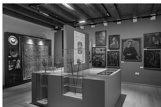
sl.11. Pogled na kulturno – povijesnu zbirku, sjeverni dio drugog kata palače Gabriellis