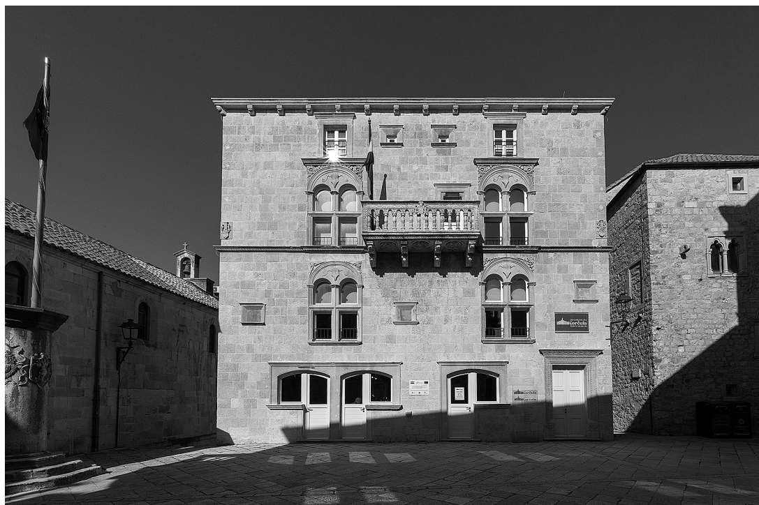
sl.1. Istočno pročelje palače Gabriellis, 15. – 16. stoljeće