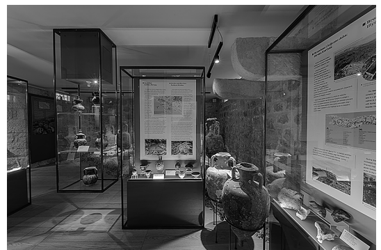
sl.2. Pogled na arheološku zbirku u suterenu palače Gabriellis