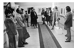
sl.6.-8. Stalni postav Međunarodne poklon zbirke crteža, grafike i male skulpture 80-tih god. XX. st.