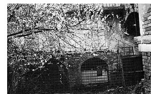
sl.1.-3. Palača Franulović Repak prije adaptacije zgrade krajem sedamdesetih XX. st.