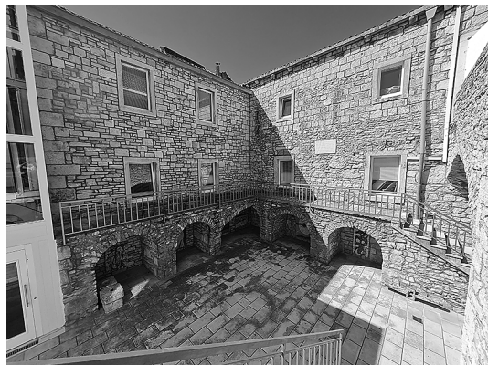
sl.4. Unutrašnje dvorište palače Franulović Repak, 2023.