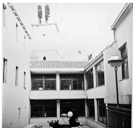
sl.5. Atrij Centra za kulturu Vela Luka s pogledom na galeriju, početak 80-ih XX. st.