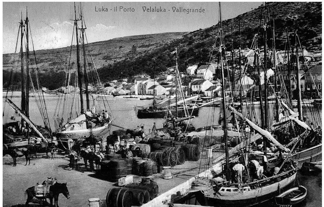
sl.1. Živi lučki promet u Veloj Luci početkom 20. st. Zbirka preslika razgednica Arhivskog sabirnog centra Korčula – Lastovo SCKL