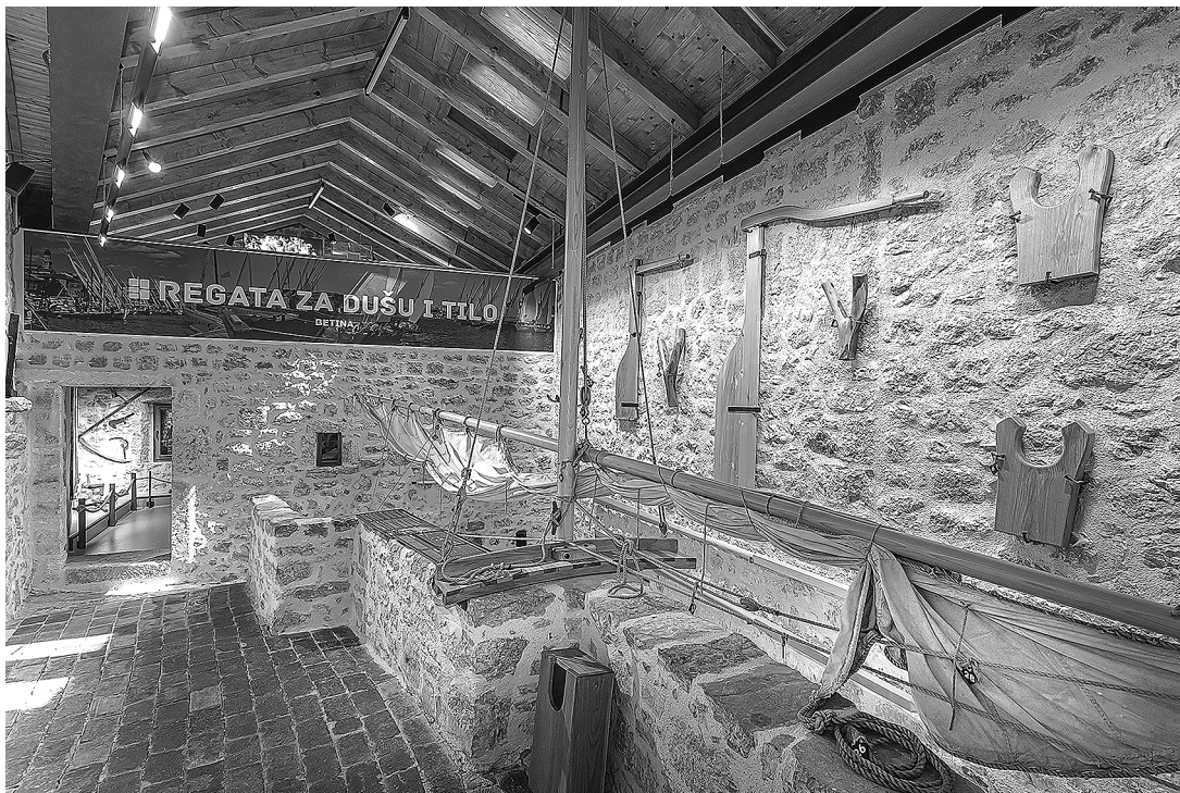
sl.3. Muzej betinske drvene brodogradnje - središnja galerija