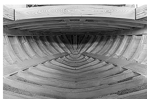
sl.5. Obnovljena gajeta Jaka prije porinuća