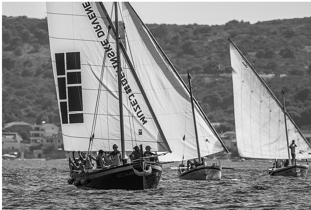
sl.14. Gajeta Marija na Regati za dušu i tilo 2021. godine