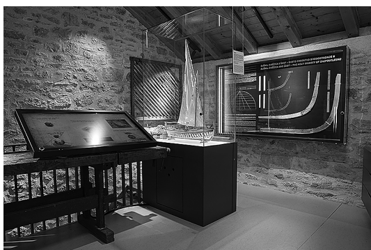
sl.4. Muzej betinske drvene brodogradnje - soba tajni zanata

u procesu kreiranja stalnog postava oblikovala se zajednička energija koja je zapravo nosila cijeli projekt. Ta sinergija međusobnog djelovanja nastavila se i u godinama koje su uslijedile. Muzej je aktivan u lokalnoj zajednici, pokretač je različitih ideja i inicijativa, partner, suradnik i prijatelj. Zajedno s baštinskim udrugama otoka Murtera, djeluje s ciljem očuvanja kulturne baštine cijelog otoka. Zajedničkim projektima i programima jača se lokalni identitet i međusobno prijateljstvo.