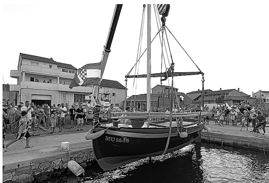
sl.15. Gajeta Marija na porinuću

najprepoznatljiviji simbol Betine. Prošlo je gotovo sto godina od njezine izgradnje u škveru Filipijevih u Betini. Cicibela je od te daleke 1931. prevalila dug put, promijenila četiri vlasnika i prošla mnoga mora i plovidbe. Svi su vlasnici o njoj govorili s ljubavlju i poštovanjem. Nebrojene su priče koje se još mogu ispričati o njoj.