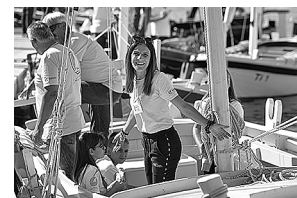
sl.9. Jedrenje u leutu Gušte

Obnovljena Cicibela ponovo je porinuta 24. srpnja 2011. godine. U ožujku 2017. Ministarstvo kulture i medija Republike Hrvatske službeno ju je proglasilo hrvatskim kulturnim dobrom. Danas se Cicibela nalazi u najistaknutijem dijelu muzeja na otvorenome MBDB-a. Danas su joj glavne uloge edukacijska i prezentacijska. Na njoj se održavaju radionice, prezentacije, koncerti... Ona je