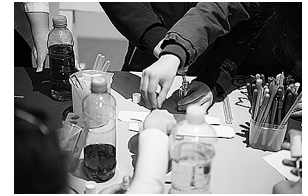
sl.9. Sušak – Radičeva ulica (Nova tržnica), S. Rovešnjak, 1925., razglednica, Vladimir Smešny

Shown in the exhibition, along with numerous items of Alga packaging and advertising materials dating from the 1920s and 1930s, were objects that tell of life in Sušak that, like Alga, had its golden years in the interwar period.