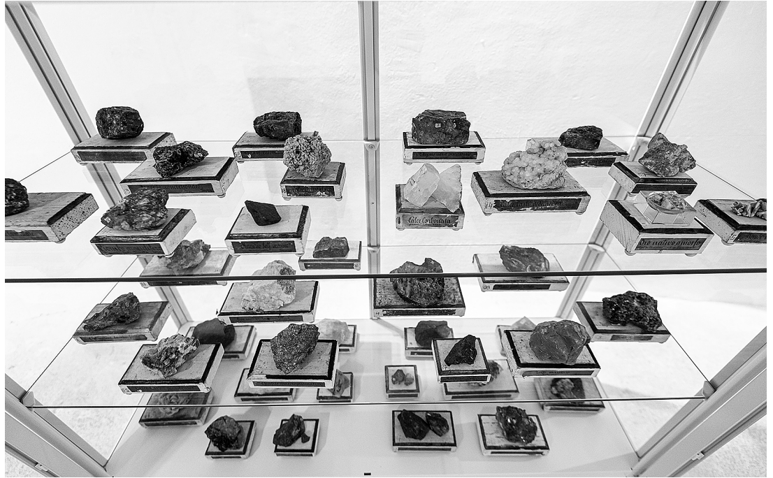
sl.9. Predmeti iz Zbirke minerala i stijena