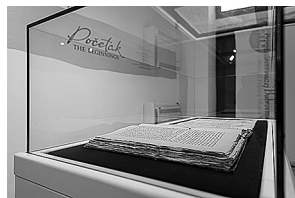
sl.1.-6. Postav izložbe Početak u Prirodoslovnome muzeju Dubrovnik