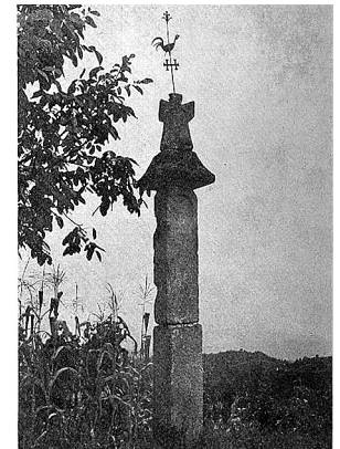
sl.1. Sveti vugel , detalj stalnog postava Muzeja „Staro selo” Kumrovec.

IM 54, 2023. IZ MUZEJSKE TEORIJE I PRAKSE MUSEUM THEORY AND PRACTICE