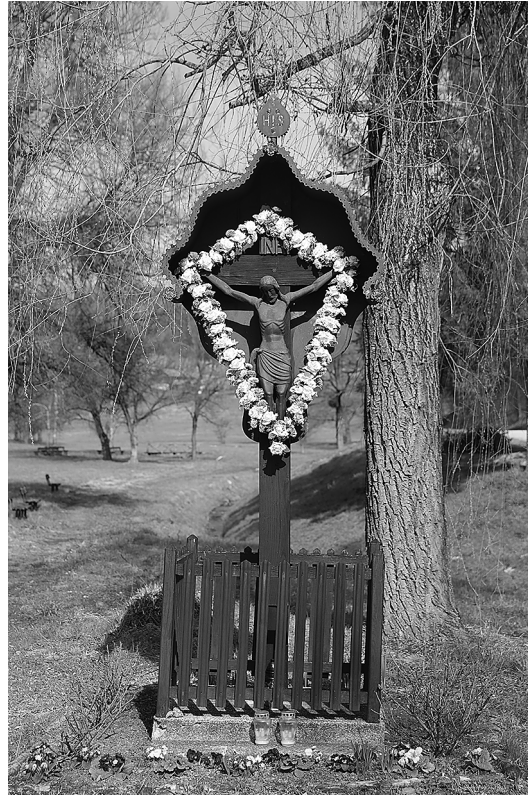
sl.7. Raspelo u Pušći, župa Zagorska Sela.

Kad su se raspela počela postavljati na području Kumrovca i okolice? U kolektivnoj memoriji mještana najčešći su odgovori da je taj običaj počeo prije više od sto godina. Poznato je da se za postavljanje raspela ili kapelice trebalo dobiti dopuštenje crkvene i svjetovne vlasti. Raspela i kapelice poklonce uglavnom su podizali