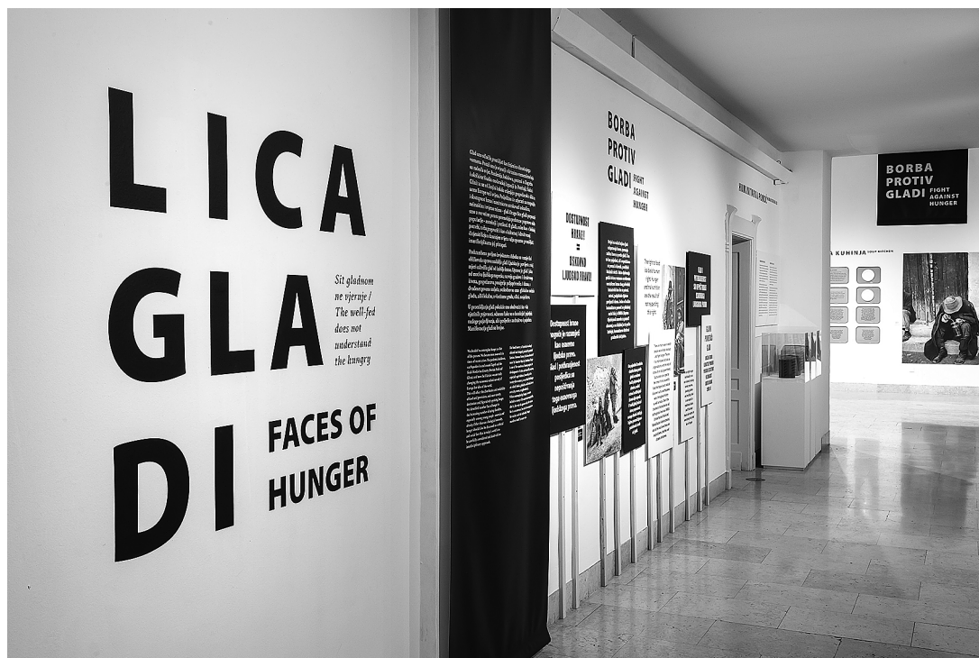
sl.1.-9. Izložba Lica gladi , Etnografski muzej Zagreb

IM 54, 2023. POGLEDI, DOGAĐAJI, ISKUSTVA VIEWS, EXPERIENCES, EVENTS