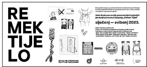
sl.10. Predstavljanje kampanje RemekTijelo profesoricama