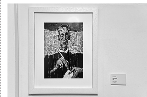
sl.5. Crtež Duje Medića Dum Marin Držić (2018.) i slika Tonka Smokvine Vidra (2015.)