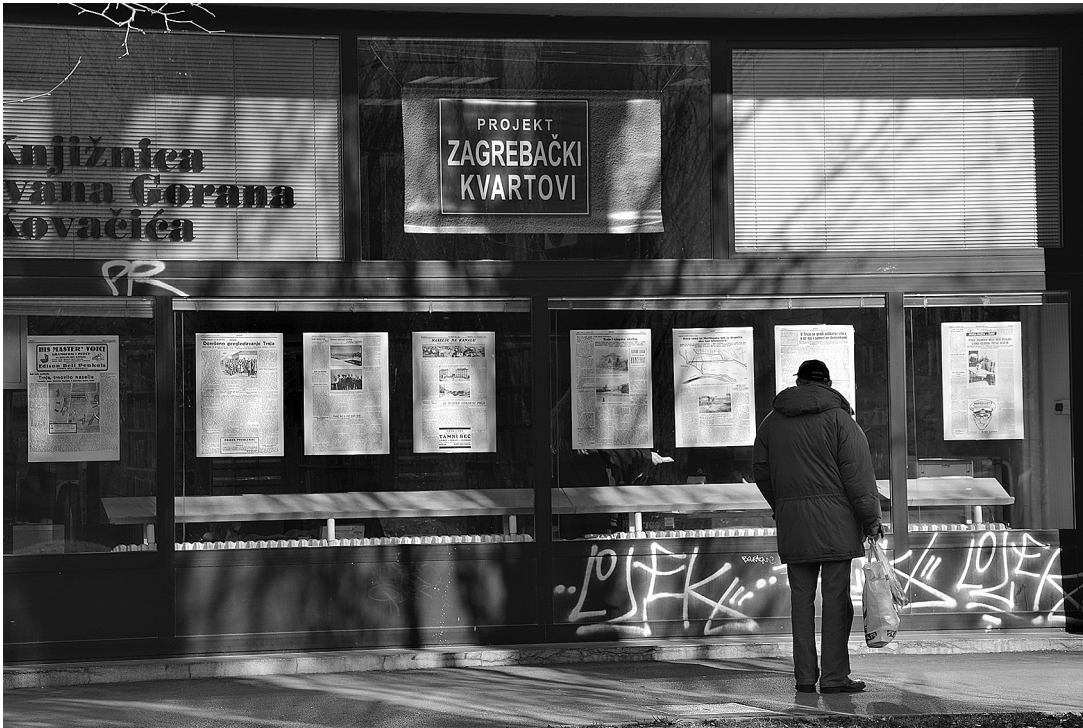
sl.4. Ulična izložba A koje su vaše kvartovske priče? . Fotografirao Tihomir Stančec, 2017.

čije su životne priče našle svoje mjesto u muzeju. Na taj su način akteri bili uključeni u proces realizacije projekta od njegova početka, i to kao aktivni sudionici, pa sve do kraja – do uvrštenja tih zapisa u izložbe. Time je cilj postavljen na početku – povezivanje sa širom društvenom zajednicom „...postao i glavni rezultat ovoga projekta” (K. Strukić).