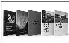
sl.1. Naslovnica publikacije (fotografija Ekipa iz Retkovca , snimio Robert Goršić, kraj 1970-ih, vlasništvo obitelji Goršić)