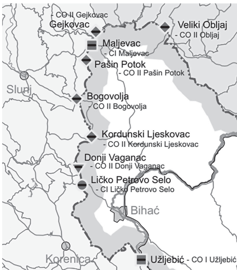
Sl. 6. Karta carinskih ispostava i odjeljaka Republike Hrvatske na području Korduna