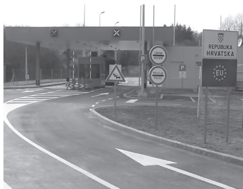
Sl. 5. Carinska ispostava na graničnom prijelazu Kordunski Ljeskovac (Izvor: Pristup ostvaren 12.3.2022. https://www.rakovica.net/index.php?start=100 )