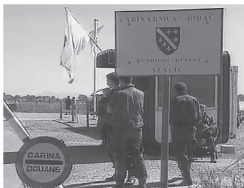
Sl. 4. Carinska ispostava Izačić nakon VRO Oluja i deblokade Bihaća 1995.