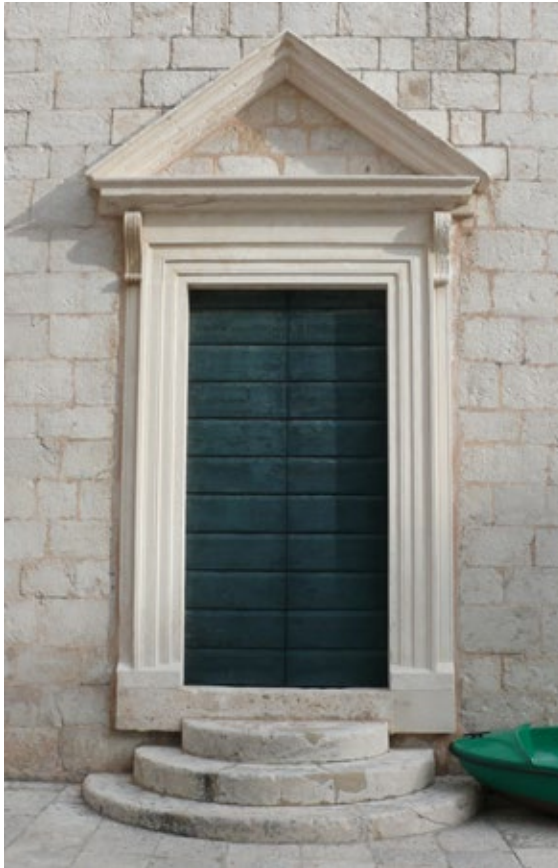
4. Glavni portal crkve sv. Đurđa

St. George, main portal