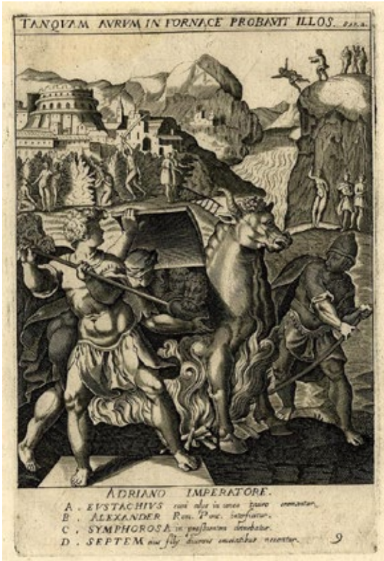
6 Jan van Haelbeck prema N. Circignaniju, Mučeništvo svetog Eustahija , 1600. – 1620. (iz serije Ecclesiae militantis triumphii ), bakrorez, 196 × 131 mm, London, The British Museum, inv. br. 1863,0509.770