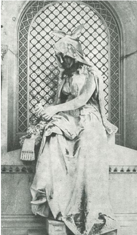
5 Ivan Rendić, Nadgrobní spomenik Stevana Ivankovića, detalj: alegorija Hercegovke, 1883., pravoslavno groblje u Trstu

Ivan Rendić, Tombstone of Stevan Ivanković, detail: allegory of Hercegovina, 1883, Orthodox cemetery in Trieste