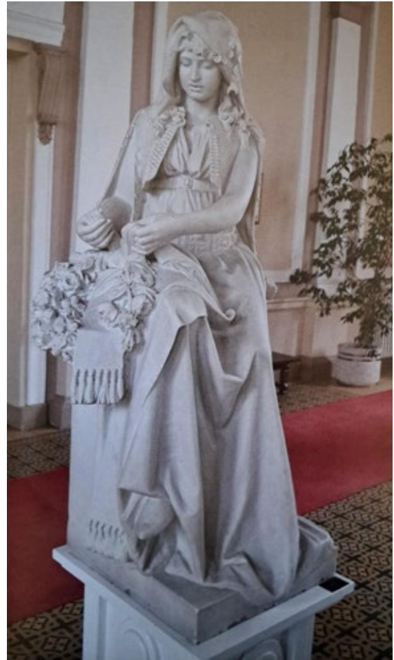
6 Ivan Rendić, Alegorija Hercegovke, 1924., za nedovršeni Mauzolej Frana Petrinovića na Supetru

vijenaca nose središnji uspravni kvadar gornjih stranica odrezanih bridova koji nosi sužavajuću prizmu s uklesanim križem na vrhu. Tendenciju da stojeću žensku figuru stavi bočno uz sarkofag i ispred postolja pokazuju spomenici Ivanu Perkovcu (1875.), Petru Preradoviću (1879.) i Anti Starčeviću (1903.). 32 Sjedeći ženski lik prisutan je na spomeniku Carmeli Dall'Asta-Mohović (1900.) na riječkom i, kao alegorija Vjere , na spomeniku obitelji Katalinić (1901.), nekoć na sustipansko-me groblju. Ženski lik javlja se i kao gologruda alegorija Uspomene u Mauzoleju Franje Borellija (1886. – 1888.) na zadarskom groblju; 33 te marmorna alegorija Um koja sjedi na brodskoj elisi u atriju tršćanske palače Lloyd (1887.). Brončani odljev sadrenoga modela (koji je kipar ponio sa sobom prilikom preseljenja iz Trsta na Brač, 1921.), stoji u dvorištu supetarske Galerije Ivan Rendić (sl. 7–8). 34 Sve su to mlade spokojne, sjetne i kontemplativne žene koje sjede na uglu postolja. Veliki i napuhnuti raskošni nabori skrivaju njihova bedra i noge, otkrivajući im tek bosa ili obuvena