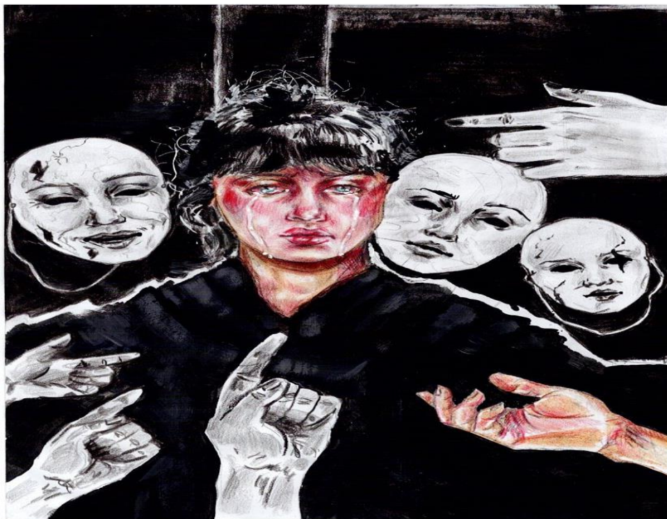
Slika 1: Lice stvarnosti

Poruka rada: Stvarnost ne znači prilagođavati sebe tuđim standardima. Djelo prikazuje djevojku koja svoje pravo lice skriva pod lažnim maskama kako bi bila prihvatljivija u društvu. Ruke koje pokazuju prema njoj predstavljaju sve razloge zašto se želi “promijeniti” i sakriti svoje pravo ja. Ali jedina ruka koja ne pokazuje na nju prikazana je u boji jer to predstavlja ljude koji mogu vidjeti njezinu pravu boju i koji je prihvaćaju onakvom kakva ona uistinu jest.