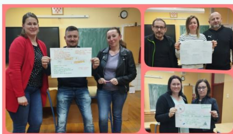
Slika 11. Radovi roditelja vezani uz teme Ovisnost o internetu, društvenim mrežama, mobitelima i videoigrama