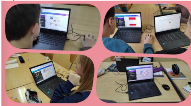
Slika 4. Učenici 8. razreda u digitalnim alatima izrađuju radove vezane uz temu Ovisnosti

Učenici 8. razreda su u digitalnim alatima pod mentorstvom učiteljice Martine Meznarić izrađivali radove na zadane teme vezane uz temu Ovisnosti (slika 4).