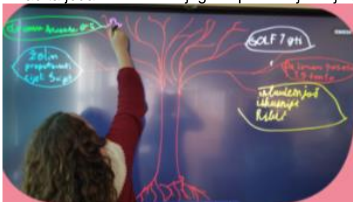
Slika 8. Učenica zapisuje svoju želju u stablo želja

Kao primjer aktivnost koju učenici mogu raditi umjesto koristiti sredstva ovisnosti učiteljica je odabrala igru pantomime. Na kraju je učiteljica na interaktivnom ekranu nacrtala stablo želja. Zadatak učenika je bio da svatko od njih nacrtaj jedan list i da u njega napiše svoju želju (slika 8).