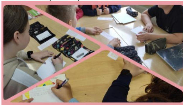
Slika 5. Učenici se u grupama dogovaraju i pišu kako bi se ponašali u određenoj situaciji

S učenicima 6. razreda su provedene radionice vezane uz moguće situacije u kojima se mladi mogu naći u svakodnevnom životu, a koje su vezane uz temu Ovisnosti (slika 5).