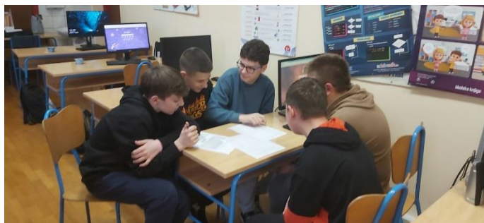
Slika 2. Koje nam stvari povećavaju šansu da ćemo bolje igrati i pobijediti

Detalje o provedenoj aktivnosti možete pogledati na mrežnim stranicama škole pomoću priložene poveznice .