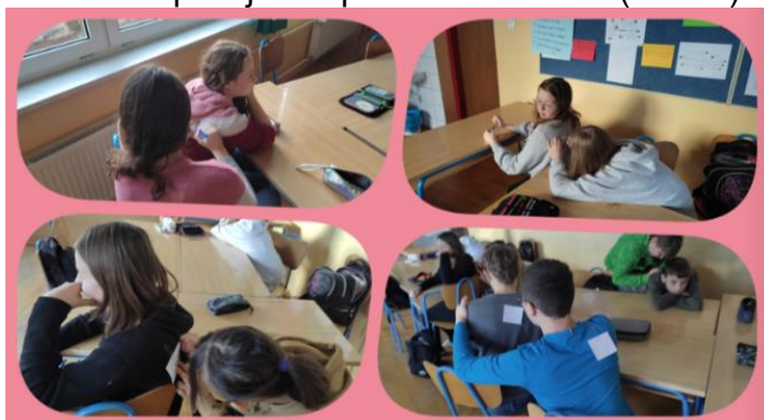
Slika 7. Učenici jedni drugima pišu jednu pozitivnu osobinu

Učenici su dobili zadatak da drugom učeniku iz razreda na post – it listić zalijepljen na leđima napišu jednu pozitivnu osobinu (slika 7).