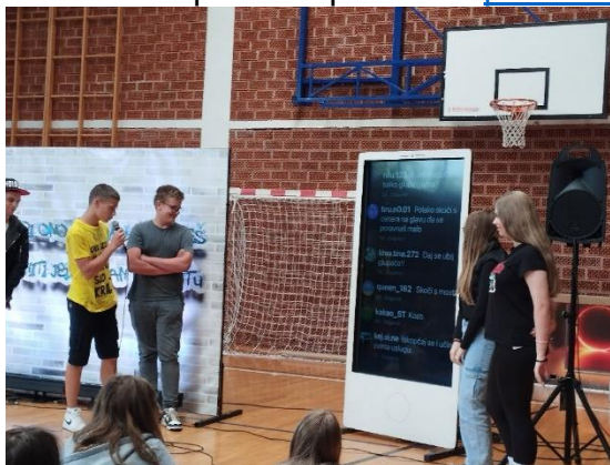
Slika 13. Učenici aktivno sudjeluju u interaktivnoj predstavi „Dislike“

Učenici 7. i 8. razreda OŠ Izidora Poljaka Višnjica i PŠ J.E. Drašković Cvetlin su 29.5.2024. aktivno sudjelovali u edukativnoj interaktivnoj predstavi pod nazivom "Dislike" (slika 13) koja je održana u OŠ grofa Janka Draškovića Klenovnik. Predstavu je održao youtuber i trap umjetnik Andre Damiš poznat pod pseudonimom Psycho Mouse. Tema predstave je bila nasilje na internetu (cyberbullying). Detalje o provedenoj aktivnosti možete pogledati na mrežnim stranicama škole pomoću priložene poveznice .