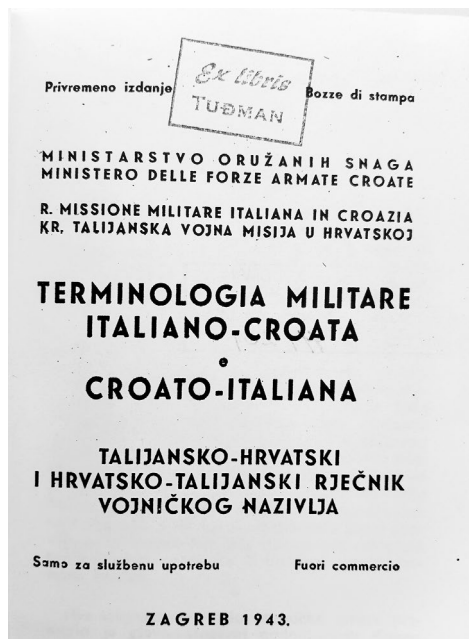
SLIKA 1. Unutarnja naslovnica rječnika Talijansko-hrvatsko i hrvatsko-talijanski rječnik vojničkoga nazivlja, Zagreb, 1943. Zagreb: Knjižnica Hrvatskoga vojnog učilišta „Dr. Franjo Tuđman”, sign. T 355/359(038) TER m

Do objavljivanja monografije posvećene hrvatskomu vojnom nazivlju Hrvatsko vojno nazivlje kroz stoljeća u izdanju Instituta za hrvatski jezik (Vrgoč 2022b), ono je bilo skicirano u nekoliko osvrtu ili poglavlja u knjigama mnogo širega opsega (Horvatić 1995; Vince 1990; Pranjković 2006; Samardžija 2004, 2008; Mamić 2007; Ham 2016, 2017), drugim riječima nedostatno istraženo te oskudno opisano. No, uz taj istraživački kompendij hrvatske vojne riječi, hrvatska je stručnojezična leksikogra-