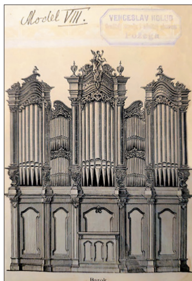
Kataloški model kućišta VIII., u privitku pisma V. Holuba, Župni ured župe Presvetog Trojstva, arhiv.