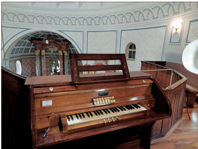
Sviraonik orgulja, župna crkva Presvetog Trojstva, Daruvar, Snimio M.S. 2.5.2022.