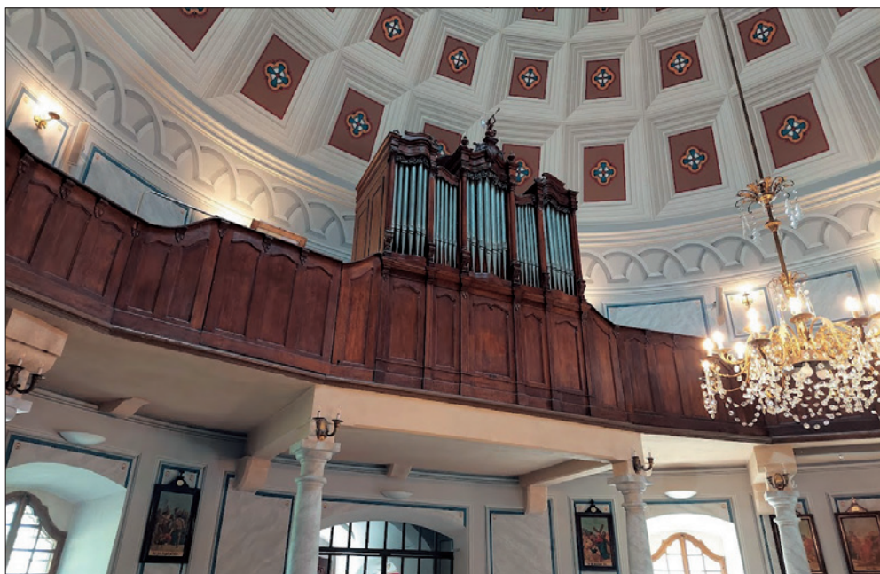
Orgulje sa pjevalištem, župna crkva Presvetog Trojstva, Daruvar, Snimio M.S. 2.5.2022.