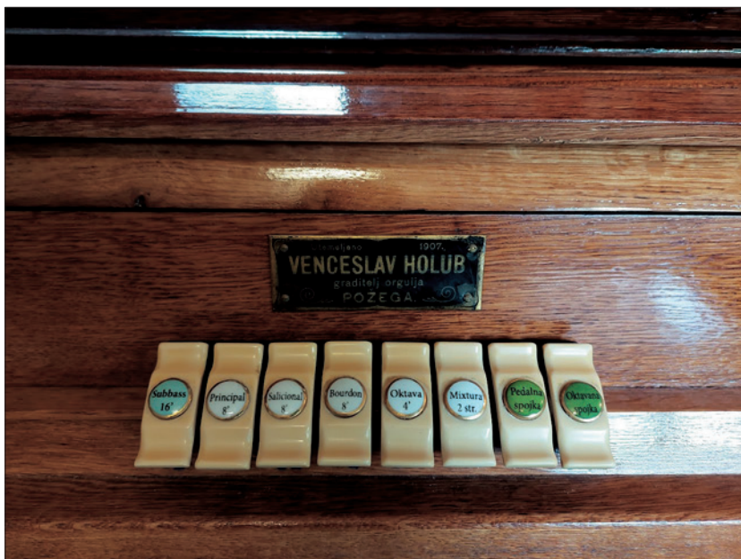
Registri orgulja, župna crkva Presvetog Trojstva, Daruvar, Snimio M.S. 2.5.2022.