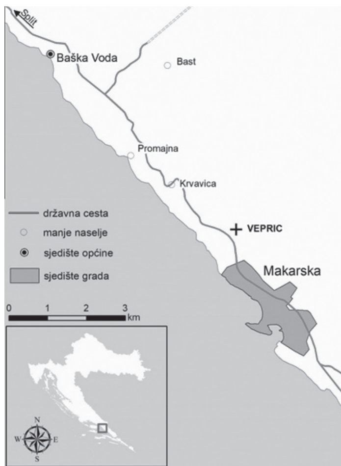
Slika 1. Geografski položaj svetišta Gospe Lurdske u Vepricu