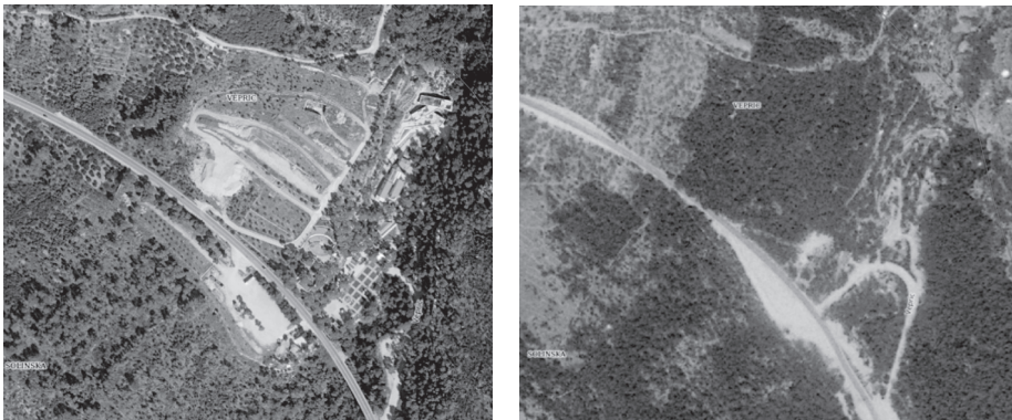
Slika 4. Zračne snimke prostora svetišta u Vepricu 1969. i 2019. godine 44

Popularnost kod vjernika Vepricu u prvom redu zahvaljuje prirodnom ambijentu u kojem je smješten. Kontrast morskog plavetnila, zelene šume i bijelih planinskih vrhova izaziva divljenje posjetitelja, pri čemu značajnu ulogu ima i replikacija svetišta u Lourdesu. Ambijent s prirodnom špiljom i potokom u neposrednoj blizini neodoljivo podsjeća na onaj u Lourdesu, što kod posjetitelja ostavlja dojam autentičnosti i izaziva osjećaj svetog mjesta povezanog s nadnaravnim, odnosno s Gospom Lurdskom.