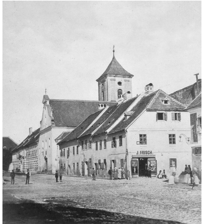
Slika 6. Franjevački samostan i crkva Sv. Križa

Malo je toga ostalo zapisano o Smičiklasovu djelovanju u Osijeku. Bila je izuzetno oštra zima u školskoj godini 1863./64. kada je Tadija Smičiklas predavao u osječkoj Kraljevskoj gimnaziji. Tijekom cijelog siječnja 1864. zabilježena je iznimno niska temperatura od -24°C, što je rezultiralo nedostatkom ogrjevnog drva te je nastava nekoliko puta bila prekinuta. Prema Ljetopisu osječkih franjevaca i kapucina, kasnije tijekom te iste godine, u gradu je vladala velika nestašica i visoki troš-