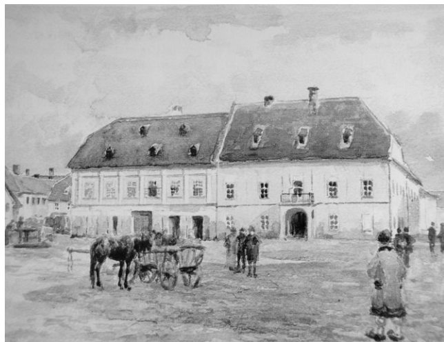
Slika 2. Pogled na središnji trg u Tvrđi