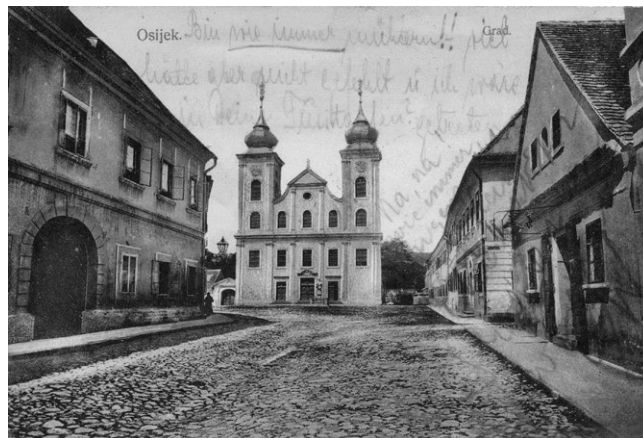
Slika 4. Pogled na Tvrđu

Godine 1862., u gradskoj skupštini, pokrenuta je inicijativa za osnivanjem dvorazredne realke, na što je odgovor Kraljevskog namjesničkog vijeća bio da bi ta institucija trebala biti trirazredna. Njihov prijedlog je