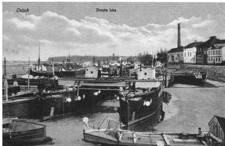
Slika 3. Živost plovidbe po rijeci Dravi

Blagajnu grada kojeg je vodio gradonačelnik Alojzije Schmidt najviše su punile dacarske pristojbe, maltarina i skelarina. Maltarina se ubirala na maltama (mitnicama), odnosno na mjestima gdje su se ubirale posebne daće od prolazećih kola i prevožene ili prenesene robe. Bez obzira na broj mitnica, maltarina se plaćala samo jednom. Skelarina se naplaćivala prilikom prelaska preko Drave skelom, bez obzira na to jesu li to bili pješaci, konji ili kola. Vinski prirez se plaćao na uvezeno vino, također i od seljaka koji su svoje vino dovozili u grad radi prodaje. Naplaćivala se i vinska daća, a visina ove daće ovisila je o veličini bačve. Ovu daću plaćali su i građani koji su točili vino iz vlastitih vinograda. Prihodi od ovih pristojbi koristili su se za troškove javne rasvjete i održavanje općinskih cesta.