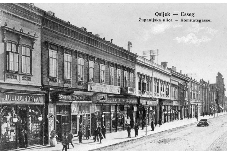
Slika 7. Gornji grad 60. godina 19. stoljeća

namjestnim učiteljem na osječkoj Kraljevskoj gimnaziji. Službu je preuzeo dva dana nakon imenovanja. Isidor Kršnjavi je završio nižu gimnaziju u Zagrebu i višu gimnaziju s položenim ispitom zrelosti, koju je završio u Vinkovcima. Nakon završene gimnazije, odmah je preuzeo ulogu učitelja, ali nije imao zakonito obrazova-