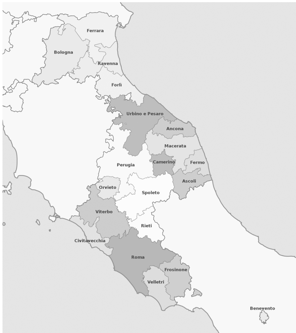
Slika 3. Provincije Papinske Države.

angažirani kartografi, koji su izrađivali karte lokalnih sanitarnih kordona. 50 Nije moguće sa sigurnošću utvrditi jesu li se pritom poslužili novom geografskom kartom Papinske Države koju su izradili Christopher Maire i Ruđer Bošković u razdoblju 1750. – 1755.